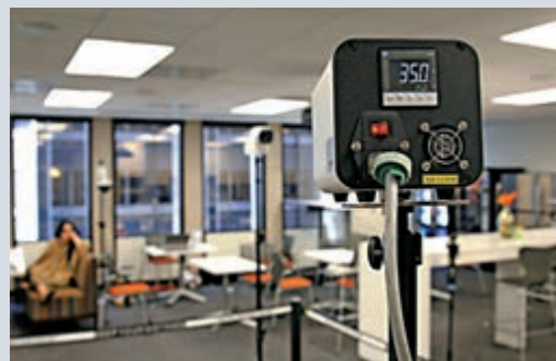
▲三藩市一家公司因應新冠肺炎疫情安裝體溫監測儀

Facebook和谷歌此前也表示，會允許僱員今年以內都在家辦公。Facebook更在5月22日宣布，預計未來5至10年，公司有一半員工可在家辦公。