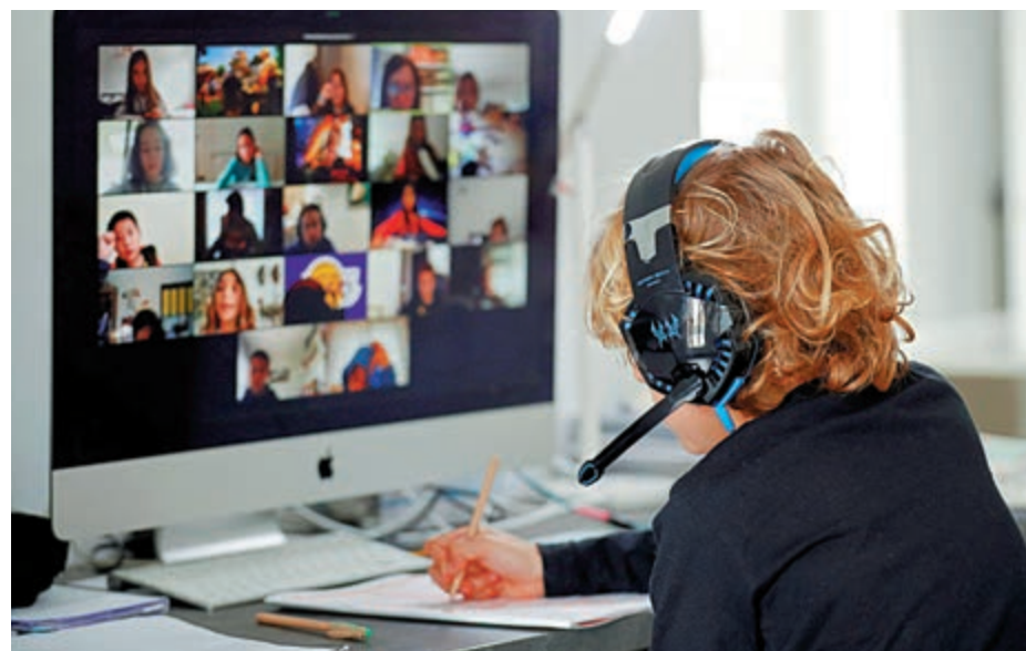
▲疫情下，居家辦公學習成為新常態