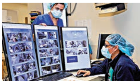
◀美國紐約西奈山醫院使用谷歌的Google Nest鏡頭，監測新冠肺炎病人情況