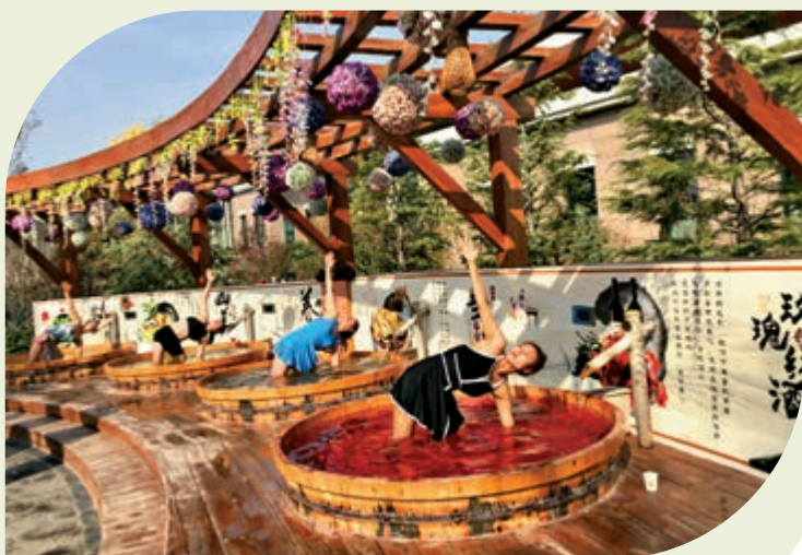
▲遊客在溫泉區，可以獨享屬於自己的一片愜意。

度假區以罕有的海洋溫泉為核心，水質清澈透明，富含30多種有益於人體的微量元素及礦物質，被譽為「南海第一泉」。同時，由兩座五星級的海泉灣維景國際大酒店、神秘島主題樂園、集美食娛樂演藝於一體的漁人碼頭、高科技的夢幻劇場、體檢中心、拓展訓練營、主題冰雪館等項目組成，還有中國目前功能最齊全、綜合配套最完善的超大型旅遊休閒度假勝地和國際會議中心。