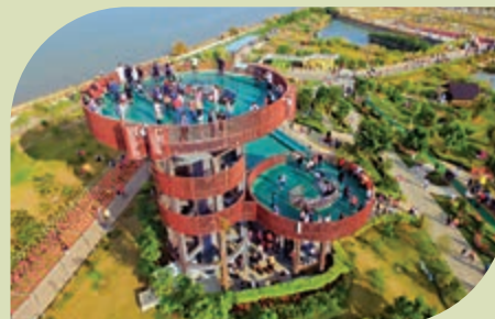
▲遊客在「天然氧吧」棧道上，欣賞濱海濕地風光。

圍繞濱海紅樹林生態專題的重點修復、鳥類招引及觀賞公園來打造國際一流的精品濕地公園、鳥類生態家園，展示橫琴島上目前棲息着的包括11種國家Ⅱ級重點保護鳥類在內的六十二種鳥類，以及六科八屬八種紅樹林植物構成的紅樹林濕地生態系統。