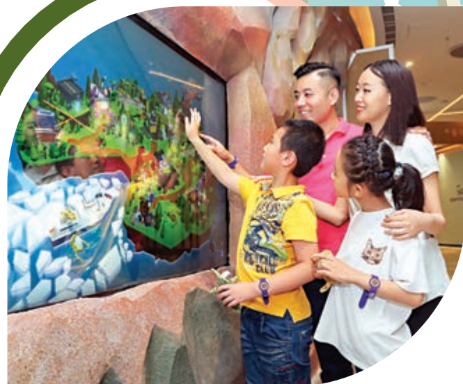
▲互動的家庭探險體驗項目，受到親子遊客歡迎。