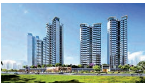
▲粵港灣樾光里效果圖。 資料圖片