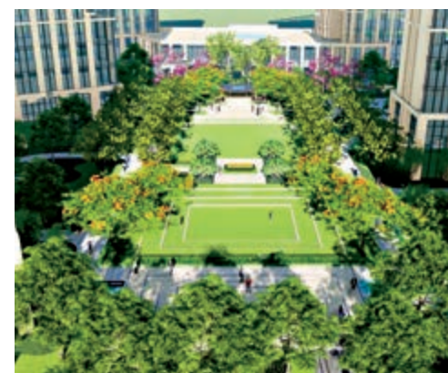
▲湖景12小區打造全齡段園林。

沿着樓梯往上走，二樓主臥可以使用現代感的簡約利落線條做鋪陳，以灰色調為基礎，搭配厚實木地板，在簡約的空間裏，營造出一種浪漫舒適的輕鬆感。主臥房間採用通透落地玻璃，為空間提供充足光線，躺在床上都可以看到窗外的風景，舒適性極佳。