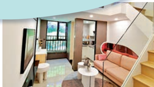
▲湖景12示範單位客廳。 資料圖片