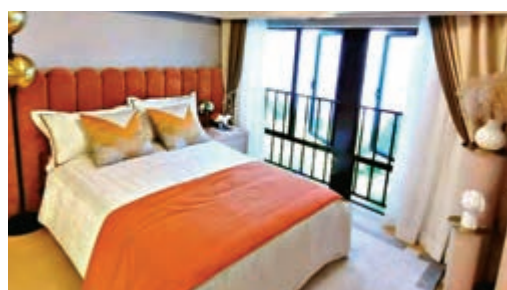
▲湖景12示範單位臥室。 資料圖片