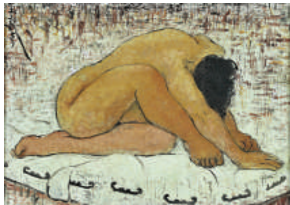
▲是次將展出的潘玉良作品

適逢中法建交五十周年，柏雅諾認為，對話是藝術節的關鍵詞。是次，在展示法國文化精品的同時，亦呈現兩種古老的文明是如何相互影響，相互汲取靈感。馬可李羅，是以西方好奇的眼睛打量東方，而到了法比恩·維迪爾，就是完全不同的深度對話。法比恩·維迪爾在中國學戲繪畫十餘年，是歐洲罕見的用書法形式進行創作的畫家。當然，二十世紀初法國蒙帕納斯的波西米亞區的自由之風，對中國當代藝術產生了巨大的影響。是次的「巴黎·丹青——二十世紀中國畫家展」，將展出徐悲鴻、林風眠、潘玉良、趙無極、吳冠中等人的作品，亦可看到，旅法經驗對他們本身的創作，以及對整個二十世紀的中國畫壇影響之深。柏雅諾續稱「在中西方文化對話的時候，香港是樞紐，也是西方走入中國文化的通道，正如現在，香港是重要的拍賣地，是中國當代藝術的重要展示的窗口。」