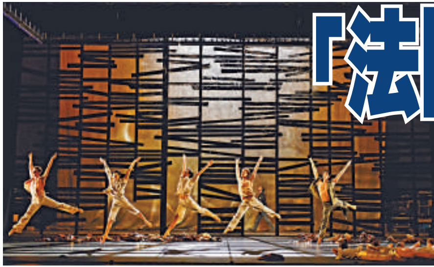
▲▼ 尼斯歌劇院芭蕾舞團《馬可李羅》劇照