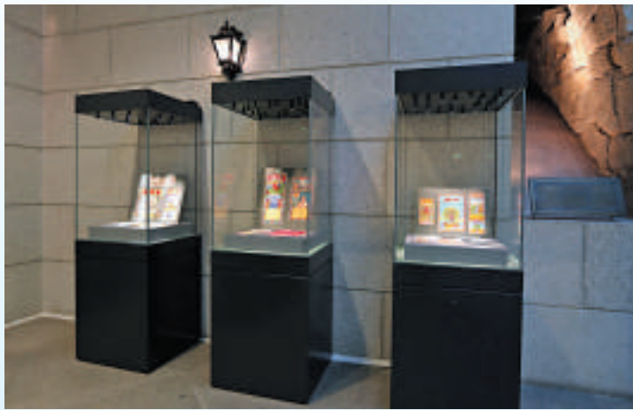
爆竹業文物展示設有多個展櫃