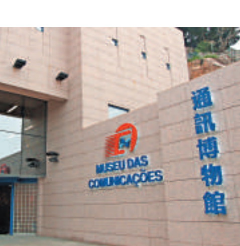
通訊博物館從集郵、電訊等科學發展為展出題材