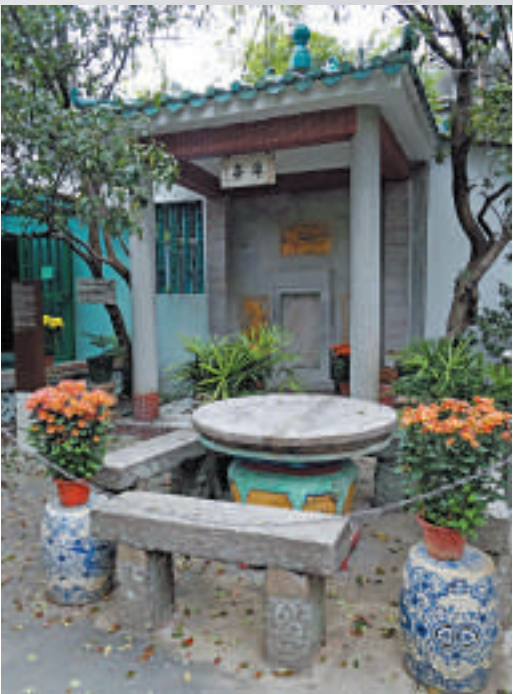
當年簽署中美不平等條約「望廈條約」的所在地

綠色文創之旅的起點設在俗稱觀音堂的普濟禪院，是澳門最大的神院與最具規模的廟宇，與媽閣廟和蓮峰廟並稱為澳門三大古廟。1992年，更被評為澳門八景之一。普濟禪院分為三殿，分別是大雄寶殿、長壽佛殿和觀音殿。在殿堂更懸掛了歷代眾高僧和不同藝術名家的書畫、書法和文物，單單欣賞這些字畫文物就仿如進入時光隧道一樣，這些字畫出處包括馳譽中外畫壇的嶺南派大師高劍父及其徒弟關山月、有嶺南三大詩家之稱的陳恭尹、著名學者章太炎等人。在歷史和文化價值都是無庸置疑的，對於訪客來說，最搶眼的展品莫過於禪院前懸掛着的一幅畫像，人稱「大天佛」，傳說善信只要手觸「大天佛」字，便可長命百歲。步入後花園，有一花崗石桌和四條長石椅，就是簽訂中美不平等條約「望廈條約」的地方。1844年，清政府勢弱日衰，列強覬覦，美國以願欲為代表，與清欽差大臣耆英於澳門簽署「望廈條約」，強迫中國開放通商港口，擴大美國領事裁判權。1944年，禪院於石桌後方立一亭碑，記述此事回憶歷史值得一看。