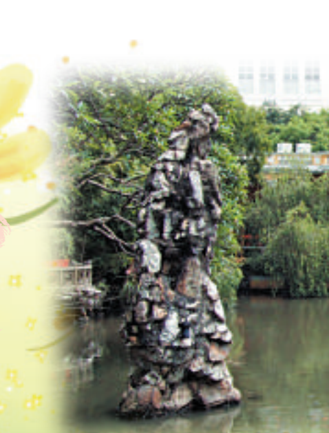
水塘周邊的休憩區是片風景秀麗的地方