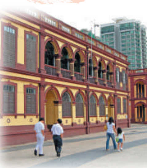
塔石廣場周圍的特色建築物別具南歐風情