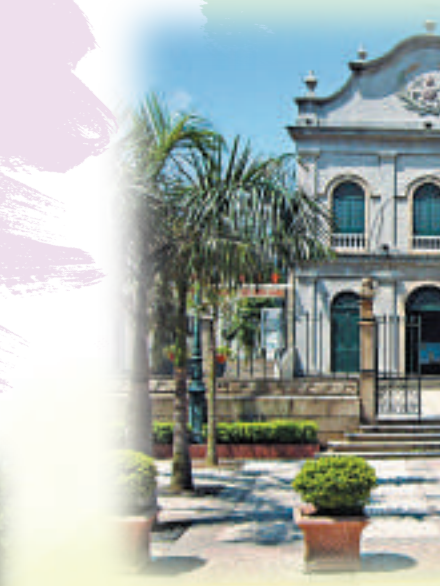
望德聖母堂曾是澳門的主教座堂

從塔石廣場徒步五分鐘，得勝花園對面就是國父紀念館。原為孫中山與其家人寓所的國父紀念館保留了建築原貌，大部分房間保持原有布置，門前匾額由中華民國首任監察院長于右任題字。展覽品有孫中山在澳門行營時所用的物品、在廣州起義時的條具、孫中山的眞跡和生前的照片。在紀念館側的花園豎立了一尊孫中山的全身銅像及「天下為公」四個大字。銅像乃孫中山之四籍友人梅屋所獻的紀念品，銅像由日本羅姆家牧田祥哉所設計。 此外，紀念館內的閱覽室為對外開放，提供與孫中山先生和台灣有關的書刊。