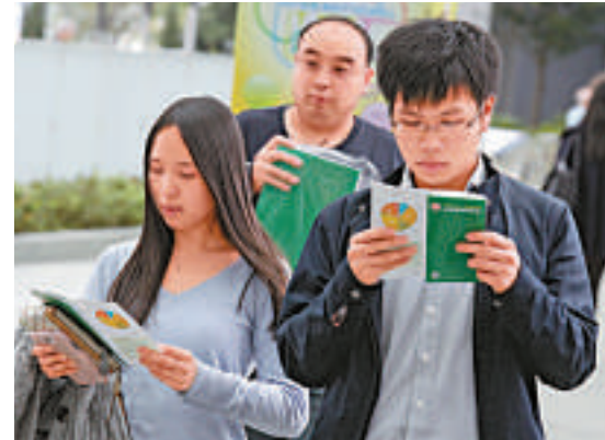
◀市民第一時間取閱預算案小冊子，了解預算案內容

曾俊華昨日表示，不排除任何增加稅收的方法，但明白任何新稅種建議都具爭議性。消息人士認為，按通脹及價格調整因素，稅收與經濟同步，除非經濟大幅增長，名義本地生產總值增長重回8至9%，否則加稅的空間不大。據了解，小組的方向亦不建議開徵新稅項或加稅，亦不建議削減減一範疇的開支，大原則是多管齊下嚴控開支及保障收入。