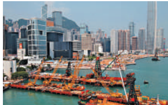
▲一系列基建工程令2014/15年度非經營開支達861億

明年起踏入基建工程「埋單」高峰期，2014/15年度非經營開支達861億，2015/16年度更會升至1018億，令該兩年分別錄得49億及317億非經營赤字，2015/16財政年度綜合帳目會錄得282億赤字，而其餘四個年度綜合帳目仍會錄得盈餘。就2015至2018年中期預測，曾俊華預計，香港經濟增長率及基本通脹率，平均每年實質增長均為3.5%。他估計2015至2019年的四個財政年度，經營帳目每年錄得盈餘，直至2019年3月底約有7992億元的財政儲備，約相當於本地生產總值29.1%，或19個月的政府開支。