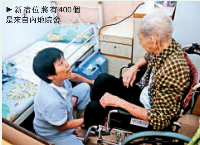
►新宿位將有400個是來自內地院舍

另外，政府亦會增撥1.76億元，於今年第二季擴展俗稱「兩元乘車優惠」的「長者及合資格殘疾人士公共交通票價優惠計劃」，至十二歲以下合資格殘疾兒童，涉及200萬元，餘下的款項則計劃將「綠色」專線小巴納入「兩元乘車優惠」中，預計明年第一季開始分階段推行。