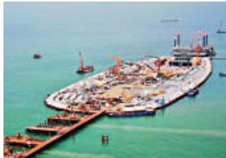
▲政府由明年起踏入基建工程「埋單」高峰期

財政司司長曾俊華發表2014年的經濟展望，今年實質本地生產總值約有3%至4%增長，名義本地生產總值增長為4%至5%，低於過去十年4.5%的平均增長率。而本港繼續保持低失業率，只要外圍形勢沒有逆轉，本港可望全民就業。通脹方面，由於輸入性通脹的價格以至住宅和商舖皆穩定，他預測全年平均的整體通脹為4.6%，基本通脹率則為3.7%。