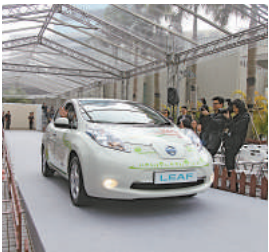
▲政府近年來積極推廣使用電動車，並提供稅務優惠