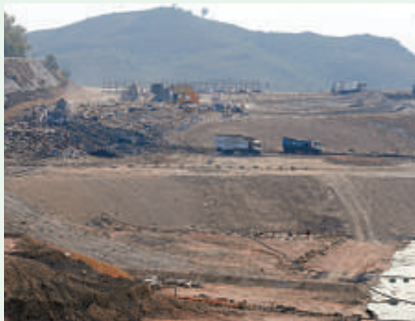
▲三個堆填區的擴建工程受拖延，建造費已上升約5%

消息人士續指，位於屯門環保園的廢舊電器回收中心佔地約3公頃，已完成招標，現時在做標書評審階段，預料可每年處理3萬噸廢舊電器，中心將配合「電器及電子產品生產者責任制」方案推行，日後電器零售商可將收回的棄置電器運往回收中心。「電器及電子產品生產者責任制」方案將於年中提交立法會討論，如方案在今年獲得通過，預料廢舊電器回收中心最快可在2016年至2017年開始運作。