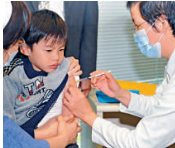
▲為加強兒童防疫力，預算案撥款擴大兒童免疫接種計劃