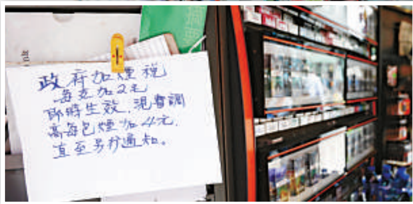
▲報販指煙草商勢必借機加價，預期日後賣香煙的利潤會更少