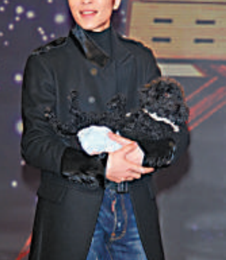
▲蕭敬騰獲圈中好友力撐 ▲KKBOX收到的信件，裡面塞滿陰司紙