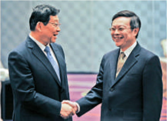
▲海協會會長陳德銘27日前往台北維多利亞酒店，會見台灣陸委會負責人王郁琦

【大公報訊】綜合中通社及中央社二十七日報道：在台北主持兩會領導人第十次會談的大陸海協會會長陳德銘27日首度與台灣陸委會主委王郁琦會面。