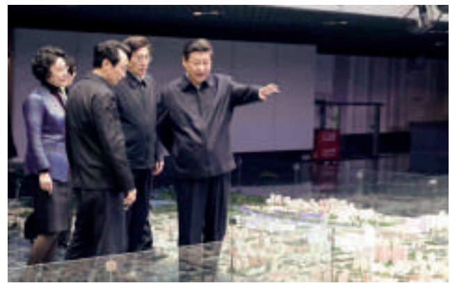
▲習近平25日來到北京市規劃展覽館,觀看專題片,察看城市模型,了解北京地理環境、規劃布局等情況

「一分部署,九分落實。」「關鍵是把藍圖一步步變為現實。」此次考察調研中很多地點的選擇,都與六點批示的內容息息相關。25日考察調研的主體就是「全面深化改革、推動首都更好發展特別是