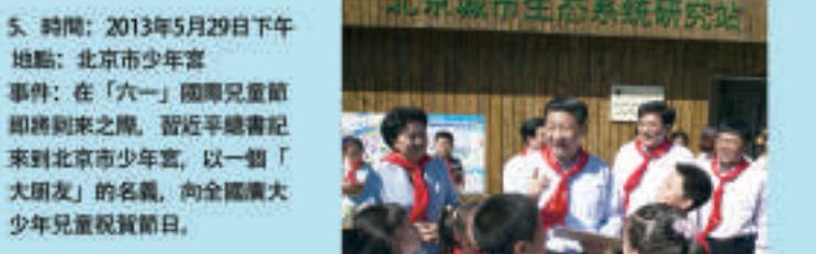
「知識越多越好,你們要像海綿吸水一樣多學習知識。既動學書本知識,又多學課外知識,還要勤於思考,多動腦,這樣就能培養自己的創造精神。」