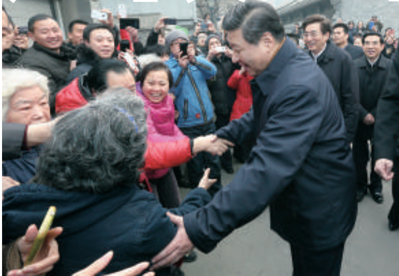
▲習近平在東城區考察玉河歷史文化風貌保護項目時與群眾握手

問問諸民生,俯仰總關情。25日的考察過程中,一路上,習近平眼到、口到、心到,了解百姓所急、所想、所盼。在交道口雨兒胡同看居民生活,走進大雜院,認真了居民的飯飯、取暖、如廁等問題。在北京老城區長大的習近平說,習近平表示,這一片胡同我很熟悉,今天來就是想看看老街坊,聽聽大家對老城區改造的想法。