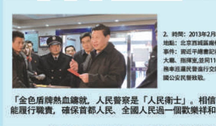
「金色盾牌熱血鑄就,人民警察是「人民衛士」。相信你們一定能履行職責,確保首都人民、全國人民過一個歡樂祥和春節。」