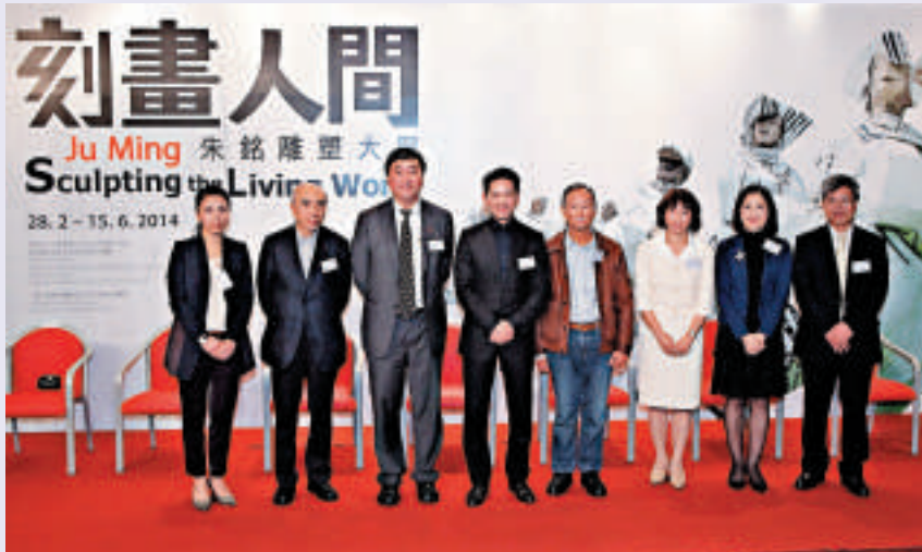
▲「刻畫人間——朱銘雕塑大展」開幕禮