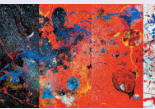
▲《Milky Way & Microscope》