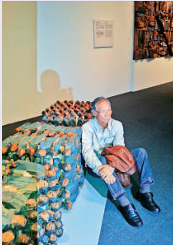
▲朱銘說這次展覽就像展示了他藝術道路的歷程

【大公報訊】記者周怡報道：國際知名華人藝術家朱銘於香港舉行的「刻畫人間——朱銘雕塑大展」，昨日於香港藝術館舉行開幕禮，藝術家朱銘、台灣朱銘美術館館長吳順令、香港藝術館總館長譚美兒及館長（現代藝術）莫家詠，於開幕禮前介紹了此次展覽的重點內容。