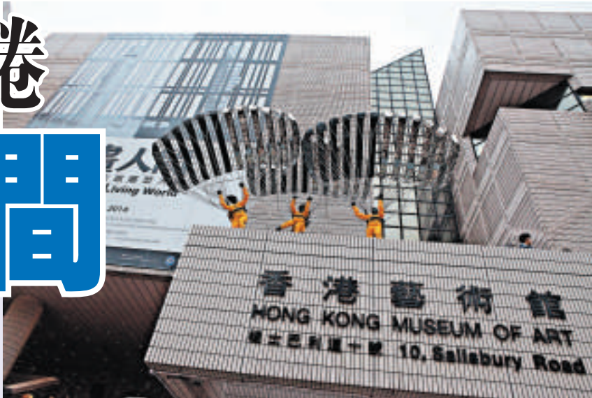
▲朱銘的作品分布在香港藝術館四周不同空間