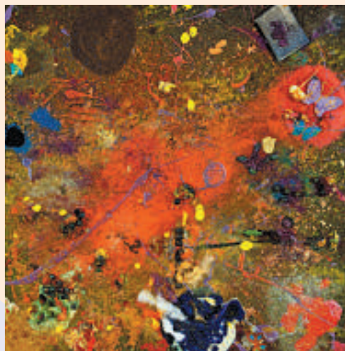
▲《Island of Spring》

「紐約客」亦是艾麗塔喜愛的創作主題，四歲那年的作品《New York》，抽象手法的潑墨，卻不同於以往的「一群海貝、一隻蝴蝶的清新柔情