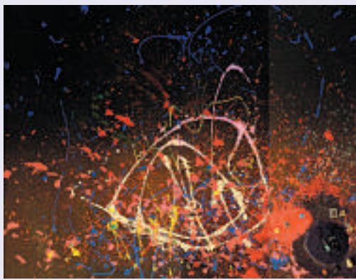
▲《New York》，再現艾麗塔的紐約回憶