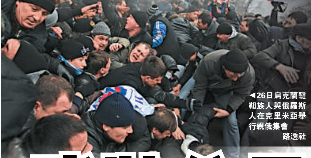
◀26日烏克蘭韃靼族與俄羅斯人在克里米亞舉行親俄集會