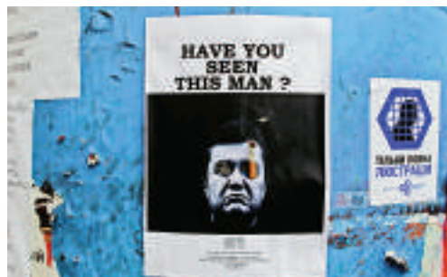
▲一張民間自製的亞努科維奇「通緝令」

法。他說：「很遺憾，烏克蘭議會今天發生的事情是非法的。」亞氏說，2月21日與反對派達成的危機解決協議未得到履行。他說：「我正式宣布我決心要鬥爭到底，直到這個關係到烏克蘭從深刻政治危機中恢復過來的重要協議得到落實。」 他警告說，任何有關在烏克蘭境內使用烏克蘭武裝部隊的命令都將構成犯罪。他說：「我作為現任總統，沒有讓武裝部長干預國內政治事務。我現在同樣下達這樣的命令。如果任何人向武裝部隊、安全機構和執法機構發出這類命令，將是非法和犯罪的。」