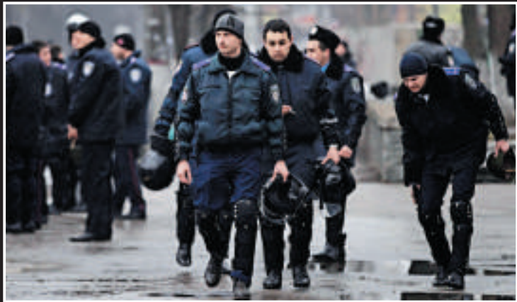
▲烏克蘭警察27日在克里米亞議會外巡邏