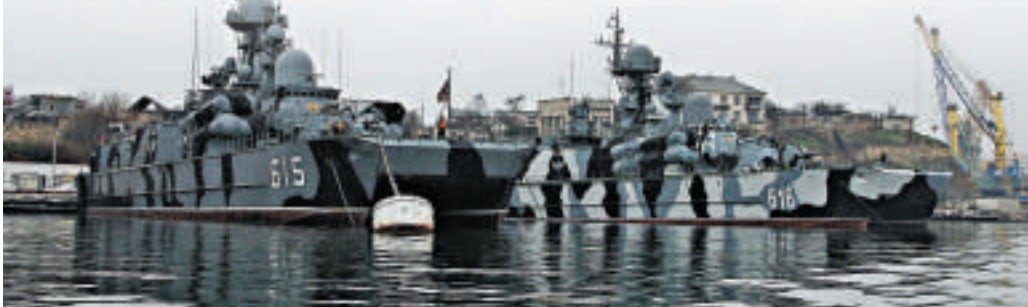
▲俄羅斯黑海艦隊的軍艦27日停泊在克里米亞港口