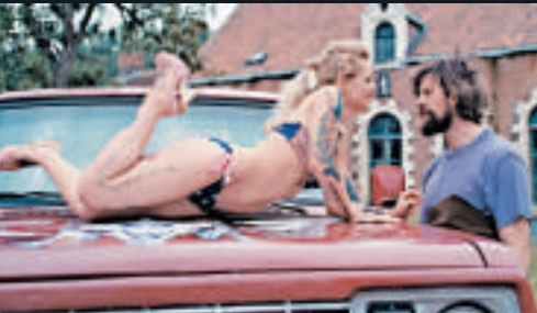
▼比利時電影《傷失的情歌》以美國鄉謠作為背景