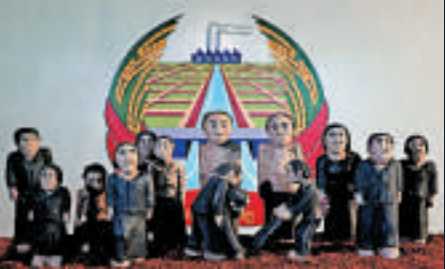
▲東埔寨導演潘禮德的作品《被消失的影像》