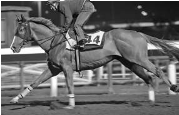
▲「一馬當先」神生步爽

「紅駿」多仗千六米入位、接近，今次改以田泰安策騎，爭勝分子。「陽明星星」上仗贏此程，賽後保持佳態，仍再以韋達策騎，還得加以追捧。「御星鷹」連仗表現平常，落三班千四米跑得接近，千六米增程作戰，配柏寶上陣，宜敲半冷。冷腳取「勝利戰略」。