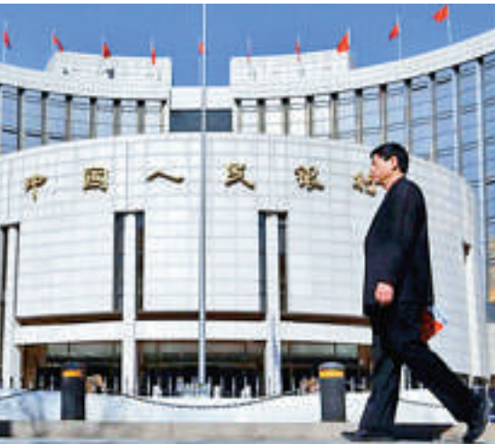
▲央行周四開展600億14天期正回購，兩周合計回籠資金逾2600億

【大公報記者倪晨上海二十七日電】中國央行周四在公開市場進行600億元（人民幣，下同）14天期正回購操作，其中標利率繼續持平於上期的3.80%。因本周公開市場無資金到期，央行本周透過正回購操作已實現淨回籠1600億元。數據顯示，本月累計正回購規模達2680億元，本月累計淨回籠資金7180億元。