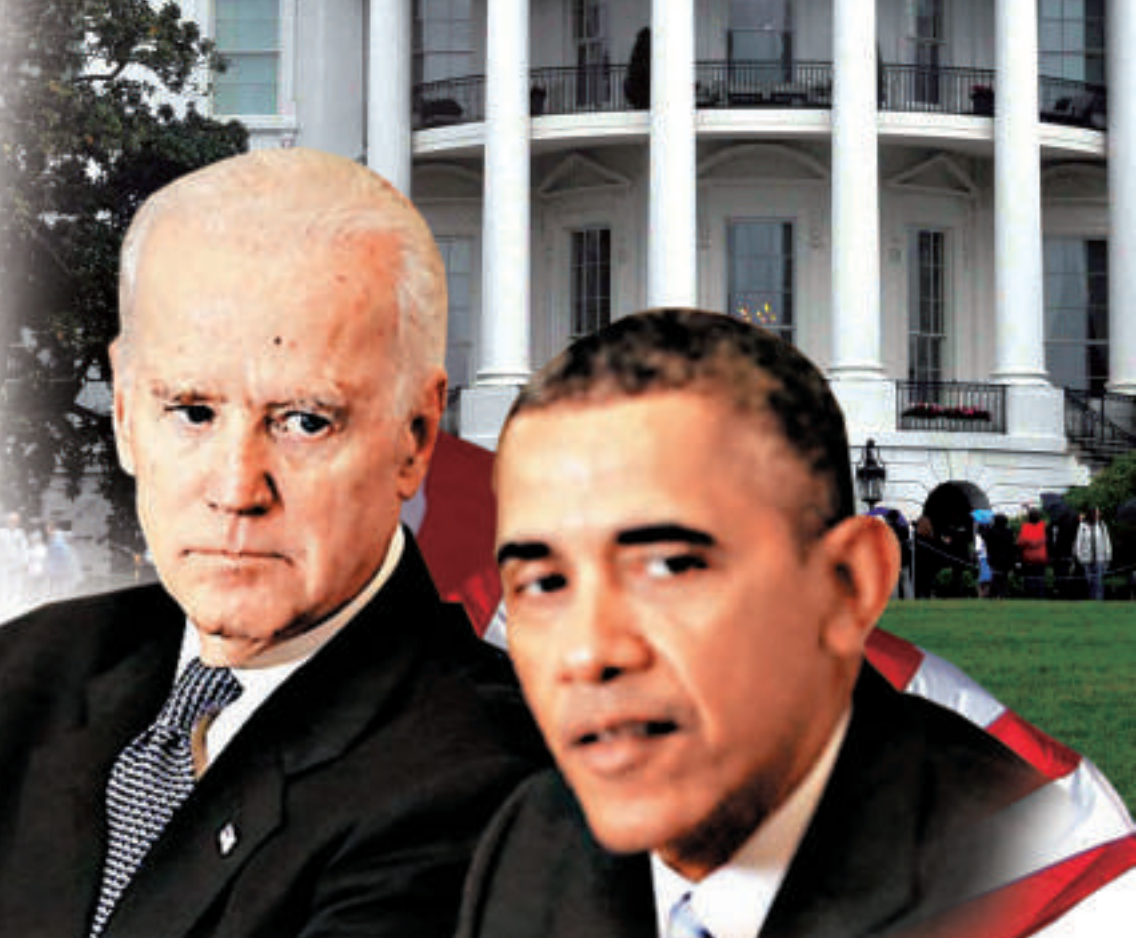
△美國副總統拜登（左）日前開腔承認他與奧巴馬（右）之間的關係處於冰點達兩年之久