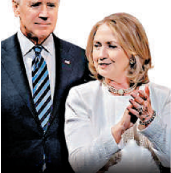
△民調顯示支持希拉里（右）和拜登（左）作為民主黨候選人角逐總統寶座的分別為73%和12% 資料圖片

拜登承認奧巴馬在大部分的決策中都遵循承諾，但是這期間兩人的關係變得緊張。而兩者關係降至冰點是在一次公開活動中，拜登搶在奧巴馬之前站出來支持同性婚姻，兩人的關係驟然變冷。拜登後來為這段講話進行了道歉，稱那是一個意外，但是奧巴馬團隊並不相信他。相反，他們認為這是拜登有意爭取部分選民支持的一次行動，從而為未來的總統大選做鋪墊。支持同性婚姻講話事件發生後，拜登很快被禁止參加重要的