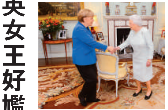
▲英女王伊麗莎白二世（右）27日在白宮會面時卻似乎很不熱絡，相互寒暄還刻意保持距離。

不過這尷尬互動，可不及英國首相卡梅倫朝默克爾臉頰冷不防親過來奇怪，默克爾和卡梅倫在唐寧街10號外微笑拍照後，卡梅倫突然親了默克爾臉頰。卡梅倫後來以握手結束這段會面。