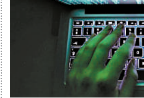
△▽GCHQ和NSA聯合攔截和儲存了數百萬雅虎用戶網絡視頻聊天的影像