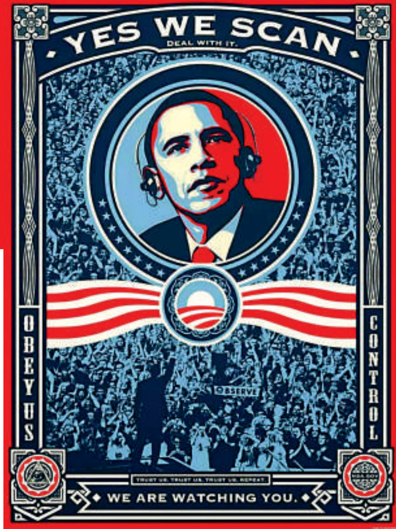
▲人權活動人士以小說《1984》為靈感製作的反對美國監控的海報 互聯網