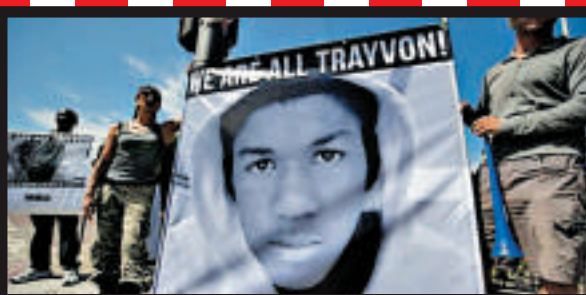
▲2013年7月14日，美國民眾就黑人少年馬丁疑遭白人社區警察齊默爾曼槍殺事件在洛杉磯示威