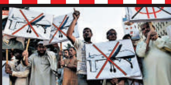
▲2013年10月23日，巴基斯坦民眾在卡拉奇示威，抗議美國發動無人機攻擊