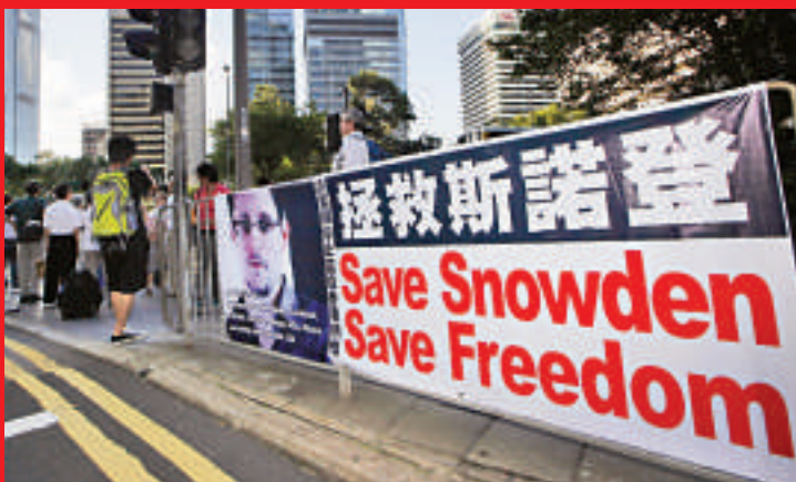
▲2013年6月18日，香港中環街頭出現拯救斯諾登的橫幅