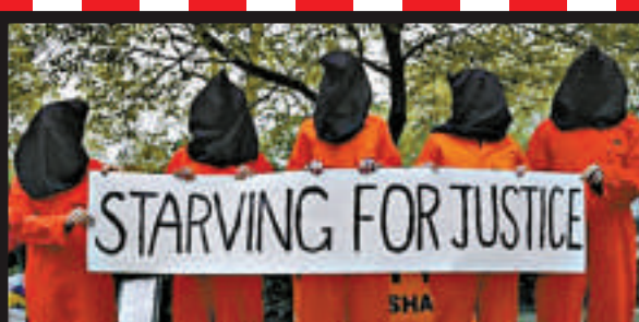
▲2013年5月18日，英國示威者在倫敦示威，要求釋放關塔那摩囚犯