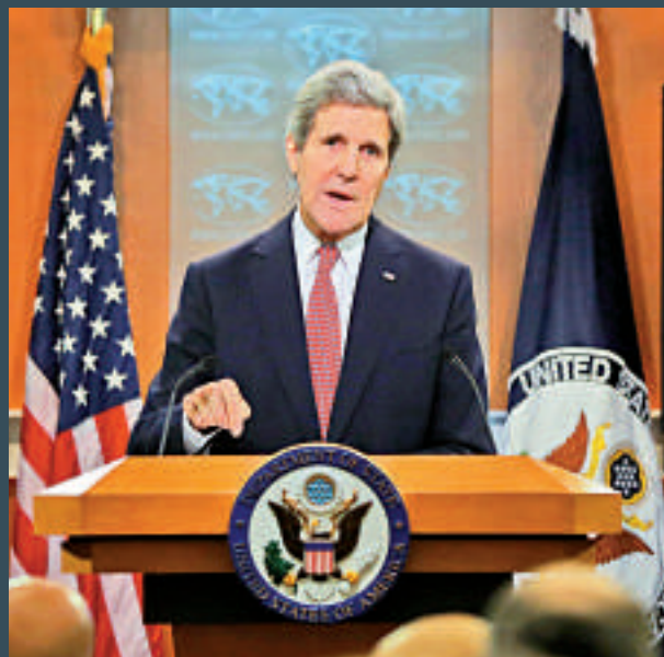
▲美國國務卿克里2月27日在華盛頓發表2013年國別人權報告

此外，報告再次提及日本存在教科書審定制度和隨軍「慰安婦」問題。此外，報告還提及日本排斥在日朝鮮半島人的「仇恨言論」，並對此表示關切。