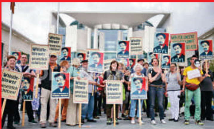
▲2013年7月4日，約50名德國人權活動人士在德國總理府門前示威，要求德國對斯諾登施以援手