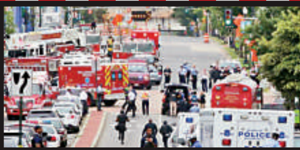
▲2013年9月16日，美國華盛頓海軍大樓發生槍擊案，救護車赴現場救援