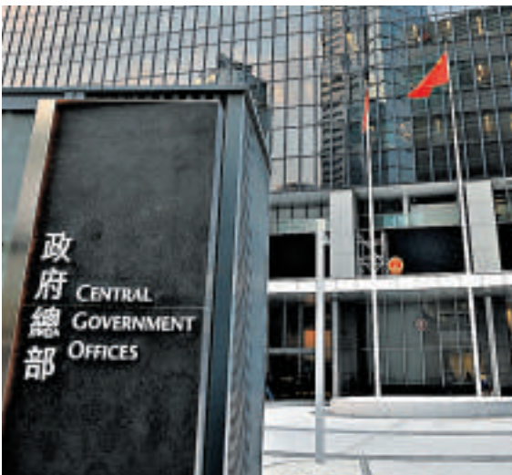
▲特區政府回應美報告時強調，成功落實2017年普選行政長官，是中央政府、特區政府和廣大市民共同願望

特區政府發言人回應說，十分重視根據《基本法》而受保障的香港的新聞自由和言論自由，香港要維持國際大都會的地位，社會能夠持續發展，新聞自由和言論自由是主要的元素，政府會繼續致力維護這些重要的核心價值。