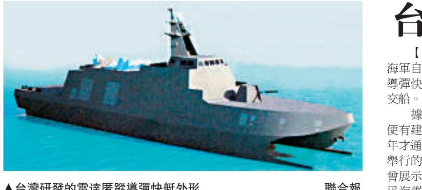
▲台灣研發的雷達匿蹤導彈快艇外形