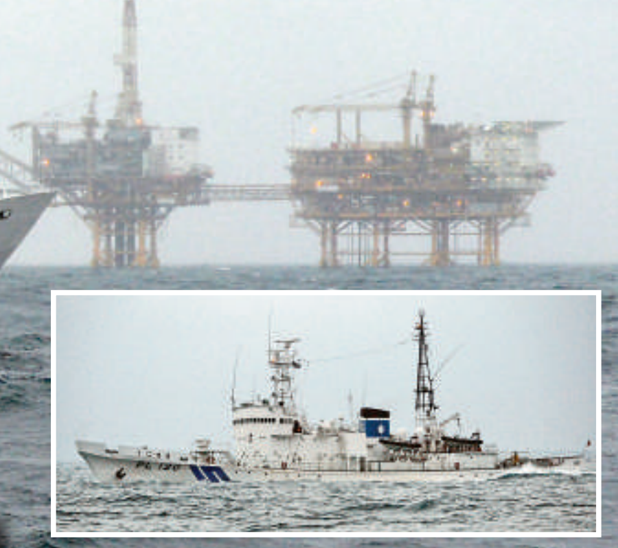
台灣海巡署執行北方海疆海域例行巡邏任務，無預警遭遇日機艦蒐證，海巡署也以對等方式向日蒐證，表明捍衛疆土與巡航護漁的堅定立場。