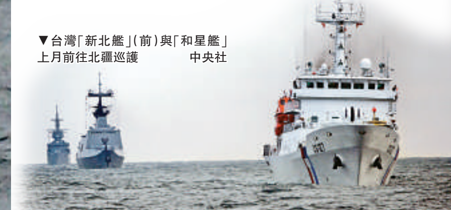
▼台灣「新北艦」(前)與「和星艦」上月前往北疆巡邏

【大公報訊】據中央社台北二日消息：台灣海岸巡防署海洋巡防總局17日派出「新北艦」與「和星艦」執行「丹陽專案」，前往暫定執法線北界海域，執行例行巡邏任務，有媒體隨艦前往採訪。大陸春曉氣田、天外天氣田都在台灣方面聲稱的暫定執法線內，這個區域正好也是中國大陸東海防空識別區與日本外防空識別區重疊區域，台灣海巡艦前往執法護漁，表明落實捍衛疆土與護漁政策。 台艦演練護漁搜救 當天「和星艦」與「新北艦」出基隆港3哩後，與海軍側護軍艦會合通聯，共同執行聯合巡邏任務，在前往最北疆巡邏前，先在彭佳嶼海域演練空軍S-70C直升機與「新北艦」的海上救難吊掛。