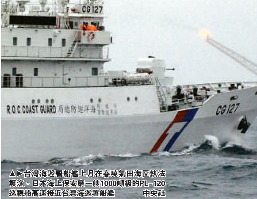
△▷台灣海巡署船艦上月在春曉氣田海區執法護漁。日本海上保安廳一艘1000噸級的PL-120巡視船高速接近台灣海巡署船艦