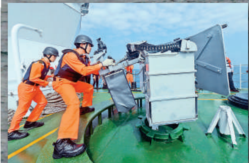
△台灣海巡艦官兵上月17日在外海演練機炮

兩岸艦艇互有默契 【大公報訊】據中央社台北二日消息：上月在日本海上保安廳對海巡艦蒐證同時，大陸方面也有一艘春曉氣田工作船在海巡艦左側錯泊，距離稍遠，且一直保持相當距離；在春曉井口平台西南0.9哩處，大陸「海洋石油603號拖」工作船透過無線電與「新北艦」通聯，了解海巡艦正進行例行巡邏任務，並未影響海巡艦蒐證工作。 台灣海巡官員透露，日方大規模出動機艦，可能是因為從2011年後，東海情勢日漸緊張，此次「和星艦」與「新北艦」出現在春曉氣田周遭海域，引來日方機艦相當關注。 對東海議題有深入研究的台灣輔大教授何思慎在表示，海巡署此行最主要目的是證明在東海甚至是南海問題上，台灣方面在「主權」議題上「從來不打折扣」，且也不因為去年4月台日簽署漁業協議，就鬆懈對專屬經濟海域，特別在暫定執法線內的巡邏勤務。