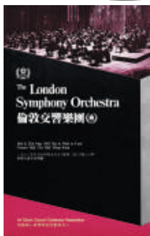
▲一九八三年五月倫敦交響樂團於香港大會堂演出海報

倫敦交響樂團（London Symphony Orchestra）三月八日在香港文化中心的演出，儘管已是該團近十年來的第三度到訪，仍是今年香港藝術節最早售清門票的節目。現時LSO一百字內的簡介，只會寫：「風靡國際舞台、被譽為全球最出色樂團之一，是倫敦巴比勤藝術中心的駐場樂團，每年的國內外演出超過一百二十場，足跡遍及世界各大音樂重鎮及音樂節。除演出音樂會外，樂團亦以高水準電視及電影原聲配樂見稱，開創英國樂團嶄新形象，廣受各國樂評人及樂迷愛戴。」