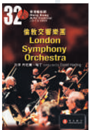
▲二〇〇四年香港藝術節邀得倫敦交響樂團來港演出

具有輝煌顯赫歷史的LSO，今年六月九日將要慶祝首場音樂會舉行一百一十周年，這標誌著LSO是倫敦五大交響樂團中歷史最悠久的一隊。同時，LSO更是歐美不少樂評人公認的「英國五大」中水平最高的一隊。古典樂壇的權威雜誌《留聲機》，更譽該團為全球五大樂團之一。LSO今日能有如此地位，有些因素是較易見到的，有些卻是隱而未現的。