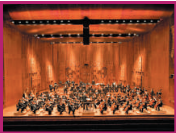
►倫敦交響樂團被譽為全球五大樂團之一