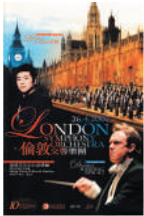
▲二〇〇七年四月倫敦交響樂團再度訪港演出