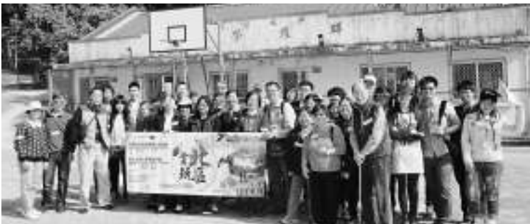
▲明愛粉嶺陳震夏中學生任導賞大使，向公眾介紹北區人文生態資源

舉辦導賞團之前，明愛粉嶺陳震夏中學中三至中五級學生須接受約兩個月的無障礙旅遊、人文及生態導賞訓練，並需要接受專業導遊的評核才畢業成為導賞員。是次導賞團報名反應熱烈，早於去年12月