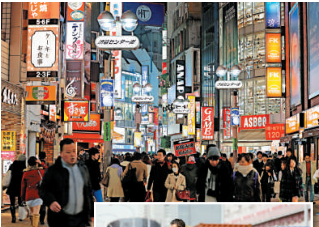
▲▶自2012年12月安倍上任首相以來，日圓貶值了19%，然而出口卻未見大復甦之態勢

安倍政府相信如果公司加薪，個人消費和投資活動就會復甦，可以抵銷銷售稅上升對經濟造成之負面影響，但現實不是安倍所想，日本公司普遍不願加薪，員工實際薪金沒有明顯增長，何來勇氣消費玩樂。近來日本內部對「安倍經濟學」開始感到憂慮，因為對上一次1997年日本提高銷售稅後，經濟受重擊。今年4月開始分階段先把5%銷售稅提高到8%，然後到2015年10月再提升至10%，經濟學者擔心，如果沒有大規模公共開支措施和額外刺激政策，可能再次面對慘