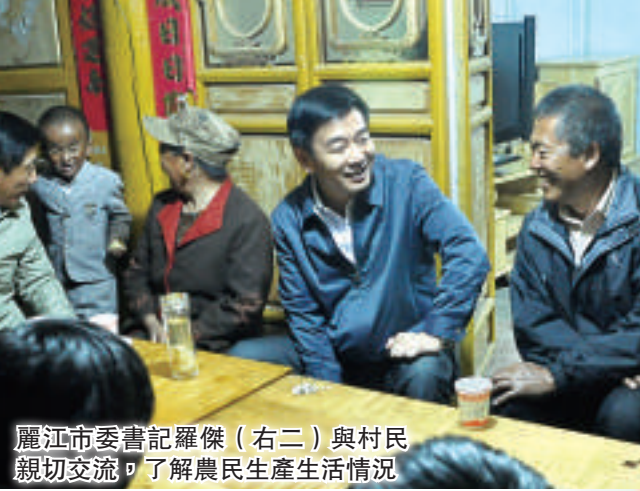
麗江市委書記羅傑（右二）與村民親切交流，了解農民生產生活情況

型產業的實體，使麗江成為文化產品的研發地，文化商品的集散地，文化人才的集聚地，文化藝術的展示地。