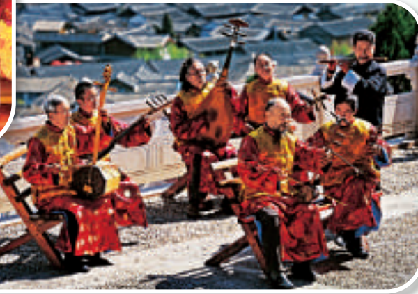
▲被稱為「音樂活化石」的納西古樂

「文化矽谷」的雛形已經為建設世界文化名市找到新的突破，當然，打造「文化矽谷」資源是基礎，環境是保障，人才是關鍵，融合是核心，科技是支撐。世界文化名市的藍圖需要長期繪就，要10年甚至20年，人們可能一下子見不到，要從規劃方面，招商引資方面去引導。羅傑認為，走好這條路，就是既要敢啃硬骨頭，也要有軟實力，還要有「耐得住」的定力、「靜