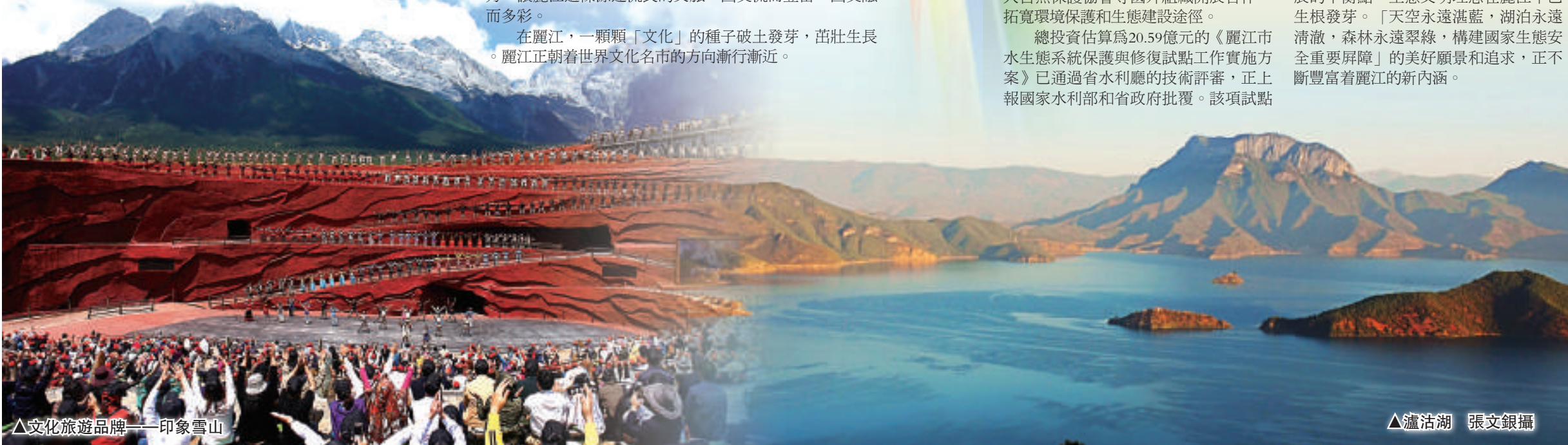
▲文化旅遊品牌——印象雪山