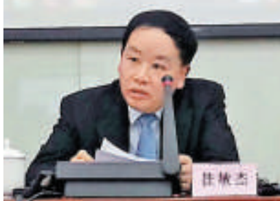
▲上交所理事長桂敏傑表示，正研究推動建立戰略新興產業板

姚建芳續稱，2013年內地大多數的傳統互聯網業務都提供了移動端服務，如購物支付、看電影、訂票、訂餐等。傳統互聯網用戶所習慣的使用服務的交互方式，正在被智能移動設備的快速增長所改變，「雙11」打通線上線下的營銷戰，也成了電商角逐零售市場的主要手段，傳統互聯網用戶的消費習慣日益移動化，移動電商正快速崛起。