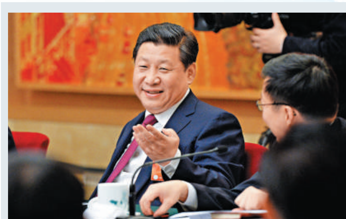
▲5日下午，習近平在參加他所在的上海代表團審議時寄語上海「百舸爭流，奮楫者先」

堅持守望相助，就要守好祖國邊疆，守好精神家園，堅守我們的根本道路和基本制度，切實維護國家安全和社會穩定；就要登高望遠，放眼全國、放眼世界、放眼未來，在審視全局中打開發展的新視野、拓寬發展的新渠道；就要牢固樹立平等團結互助和諧的思想，大力弘揚各民族同呼吸、共命運、心連心的光榮傳統，像愛護眼睛一樣維護好中華民族大家庭的團結。