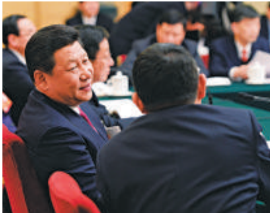
▲習近平與身旁的上海市長楊雄交流

廖昌永代表說，上海音樂學院準備推出《一江春水向東流》等3部中國歌劇，夢想把中國歌劇唱到世界舞台上。總書記表示，你講的確實是個夢想，但這要作為一個目標。沒有夢想，不去想，就根本達不到，只有想才有這個可能。