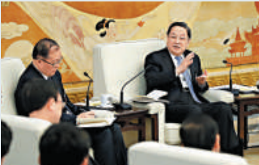
▲5日，俞正聲（右）參加湖北代表團的審議時表示，充分肯定了湖北過去一年的成績

一要堅定改革信心。當前，改革進入了攻堅期和深水區。我們必須堅定信心，堅信只有改革才有出路，最大限度集中全黨全社會智慧，最大限度凝聚改革共識，最大限度調動一切積極因素，以更大決心衝破思想觀念的障礙、突破利益固化的藩籬。二要把握改革方向。堅持和發展中國特色社會主義是全面深化改革的根本方向。必須堅定「三個自信」，增強戰略定力，從經濟社會發展需求和群眾期盼出發，找準改革的出發點和着力點，使改革有的放矢。三要抓好改革落實。把抓落實作為推進改革工作的重點，堅持問題導向，解放思想，鼓勵探索實踐，積極穩妥地抓好重大改革舉措的組織實施。