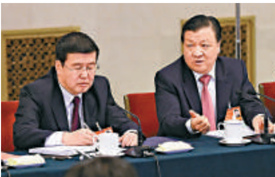
▲5日，劉雲山（右）參加內蒙古代表團的審議時稱，要像愛護眼睛一樣維護民族團結

實現穩中有為，就要在調結構、轉方式、科學發展上有為，切實提高發展的品質和效益；在深化改革、擴大開放上有為，給經濟社會發展注入強大動力；在發展現代農牧業上有為，為保障國家糧食安全發揮更大作用；在建設生態文明上有為，讓內蒙古天更藍、水更清、草更綠、空氣更清新；在保障和改善民生上有為，讓各族群眾共享改革發展成果。要大力加強黨的建設，高標準高品質地抓好第二批群眾路線教育實踐活動，以作風建設的新成效為全面深化改革、推動事業發展提供有力保障。