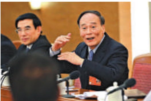
▲5日，王岐山（右）參加北京代表團的審議時稱，要認真落實黨風廉政建設主體責任和監督責任

王岐山指出，紀律檢查機關是國家治理體系的重要組成部分，要深化黨的紀律檢查體制改革，探索實