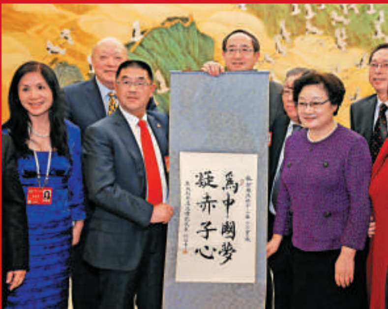
▲3月5日，全國政協副主席李海峰在全國政協機關會見列席政協會議的海外僑胞

周生賢表示，通過多項措施後，一些地方大氣質量出現積極變化。他舉例，京津冀的霧霾和去年的霧霾相比，從濃度最高值1000多降為900多。而京津冀的濃度平均值，則從六百多降為五百多。他認為，這樣的數據變化很難讓民眾切身體會到，故「希望大家能有足夠的耐心」。