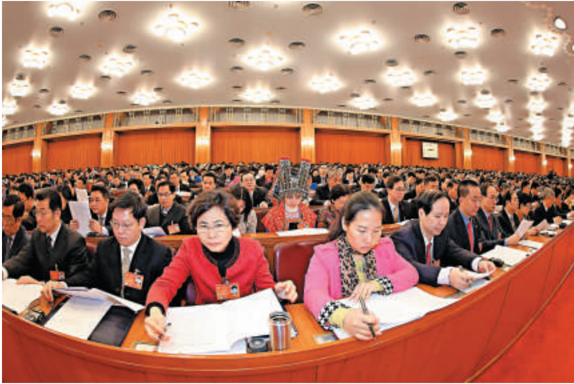
▲3月5日，人大代表出席全國人大會議

興業銀行首席經濟學家魯政委解釋，只要GDP同比仍在7.5%以上，中央就「不採取短期刺激措施，不擴大赤字，不超發貨幣，而是增加有效供給，釋放潛在需求」，未來的主要精力更多會用於推進改革；另一方面，激發民間投資能平衡穩增長及嚴控政府負債率的矛盾，「民間投資活力釋放需借助改革、打破行業壟斷和壁壘等實現，所以總理才始終將簡政放權改革稱為宏觀調控當頭炮」。