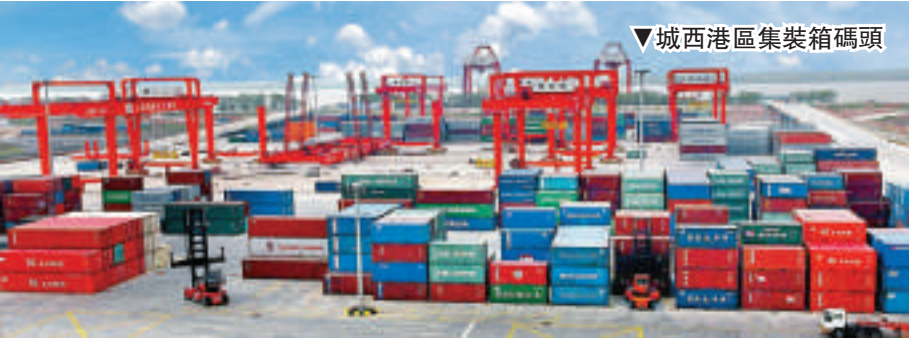
▼城西港區集裝箱碼頭

九江為加快推進「昌九一體化」步伐，按照「規劃一體化、基礎設施一體化、公共服務一體化和產業互補對接」的總方向，爭取上級支持，主動對接南昌，全力把九江打造成支撐江西經濟崛起的「雙核」之一。加快重大基礎設施