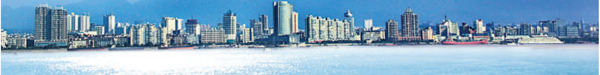
▲長江之濱、匡廬之畔—— 美麗瀟陽

江西省委十三屆七次全會作出「做强南昌、做大九江、昌九一體、龍頭昂起」的戰略部署，把九江作為江西對外開放的「門戶」城市和支撐江西經濟崛起的「雙核」之一來打造。這一宏大的戰略定位，全省聚焦九江，九江迎來了千載難逢的發展機遇。