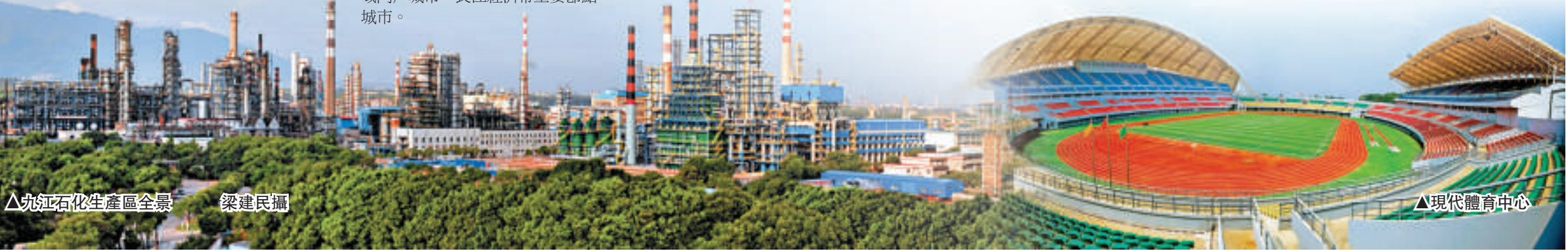
△九江石化生產區全景

九江，站在春天希望的田野上，正用自信奮力書寫新的歷史篇章，昂首闊步踏上跨越發展的新征程。