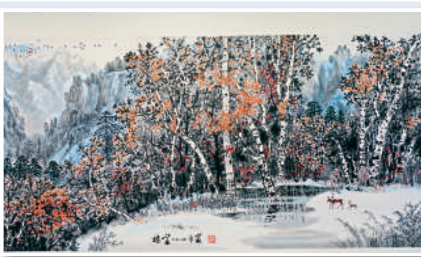
▲叢培華繪畫作品《北風》

音樂會的門票現於各城市電腦售票處發售，查詢節目詳情可瀏覽香港歌劇院網址：www.operahongkong.org