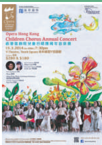
▲兒童合唱團周年音樂會演出海報