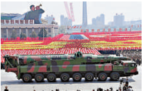
▲朝鮮在2012年4月的閱兵儀式上展示的導彈模型 資料圖片