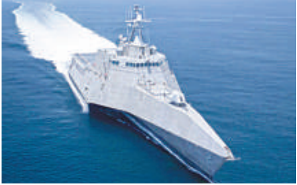
▲美國三體瀕海戰鬥艦「獨立」號

根據《美日相互防衛援助協定》，日本外相岸田文雄和美國駐日大使卡羅琳·肯尼迪交換了協議文本。在這項共同研究中，日美將製作由三個船體連接而成的三體船模型，然後交換共享強度、速度相關數據。由於三體船提速快並能確保更多甲板面積，因此可供直升機起降。美日兩國將在6年內完成研究並探討在海上自衛隊中使用。目前，美國海軍現已擁有三體船型瀕海戰鬥艦是「獨立」號。