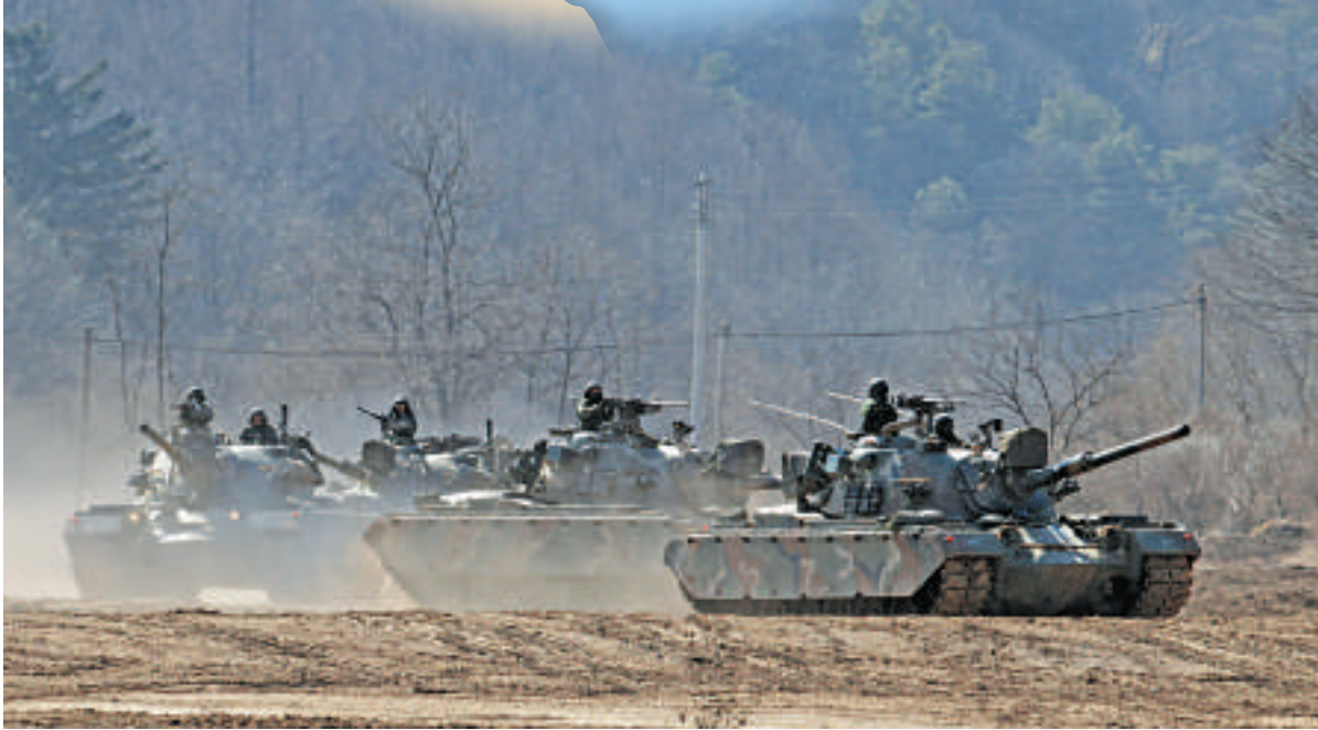
▲韓國軍隊的坦克5日進入韓朝邊境的坡州進行演習