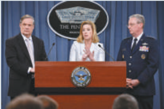
▲美國國防部官員4日在五角大樓公布新的《四年防務評估報告》

此說法引起亞洲國家和美國國會高度關注。事關美國現時正爲烏克蘭和中東問題焦頭爛額，是否仍要把焦點和資源投放放在亞洲。