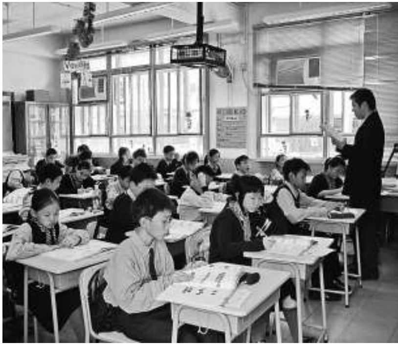
▲師生關係良好，上課時也能促進學生對教學的吸收