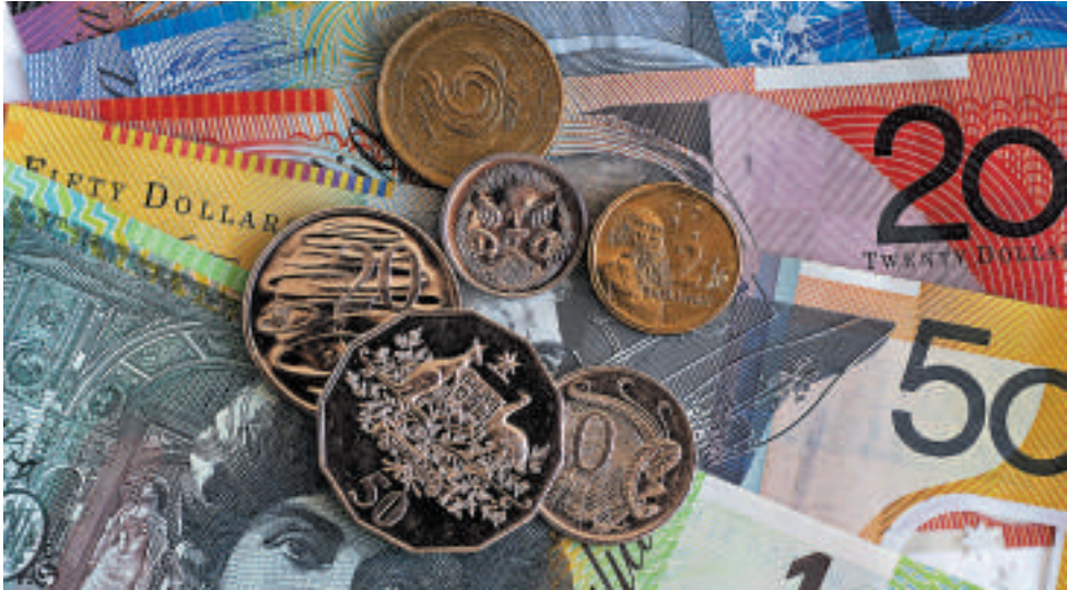
◀澳洲經濟增長加速，澳元上升到89.92美仙

本周二，市場對俄羅斯出兵烏克蘭的擔憂情緒逐漸下降，澳元兌多數主要貨幣匯率走軟。澳洲統計局數據公布後，澳元受經濟利好消息影響大幅走升。悉尼早市，澳元兌美元由經濟增長數據公布前的89.56美仙上升到89.92美仙，且澳元有繼續上行的趨勢。在過去3年裡，澳元兌美元平均匯價大約在1美元左右，比20年前72美仙的水平要高。