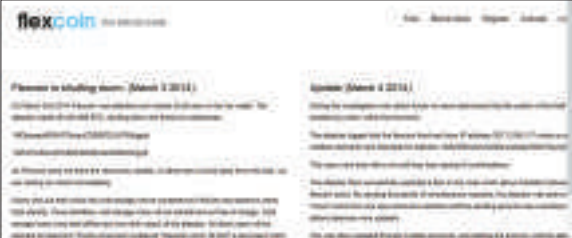
▲加比特幣銀行Flexcoin被黑客入侵，宣布關閉

關注到風險問題，中國禁止金融機構進行比特幣交易。俄羅斯監管機構對使用比特幣發出警告，又把比特幣視為非法。由於近期爆出與比特幣相關事件，一向對比特幣採取支持立場的英國，態度開始有所改變，根據英國金融時報報道，英國考慮對比特幣交易徵稅。