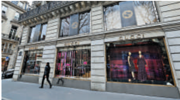
▲2月歐元區服務指數升至52.6，為32個月高位

美國供應管理協會昨日公布，2月非製造業指數由一月份的54點跌至51.6，較彭博社分析員預期的中位數53.5低，反映出美國經濟復甦不明確，服務業亦未見顯著改善。而由2009年1月至今年1月止，服務業指數平均處於53.9的水平。