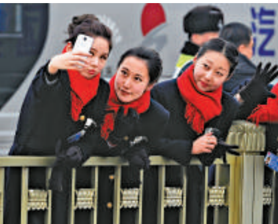
▲兩會禮儀小姐在天安門廣場合影留念

《朝日新聞》指出，中國領導人上次在政府工作報告中提及歷史問題，是1995年，當時是二戰結束50周年，因此這次可說是相當罕見。中國外交部高層曾說道：「這反映出包括國家領導人在內，整個政府的意見。」眼前中國社會對於日本的態度愈加嚴厲，這也讓李克強總理考慮在政府工作報告中提及到歷史問題。