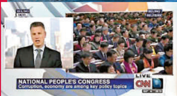
▲美國CNN電視新聞關注兩會的反腐、經濟及污染議題 互聯網