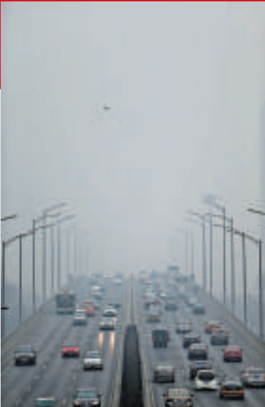
▲北京2月份空氣污染情況嚴重 資料圖片

韓國中國經濟金融研究所所長全炳瑞指出：「習近平今年年初曾對地方高官表示「唯GDP馬首是瞻」的發展觀已經過時。這一發言非常奏效。但與此同時，為了將失業率控制在可以接受的4.6%以下，增長率至少要達到7.2%。中國增長目標比7.2%稍高一些意味着不會放棄增長。」 有人預測，中國實現今年的GDP增長目標7.5%實屬並非易事。國際投資銀行法國農業信貸銀行在報告中指出：「中國目前的情況尚未達到可以實現7.5%增長目標的程度。應該將增長目標定為接近潛在增長率預測值（6%）的7%，並縮小赤字和負債規模。」前中國人民銀行（PBOC）貨幣政策委員李稻葵指出：「很難實現7.5%的增長目標。」