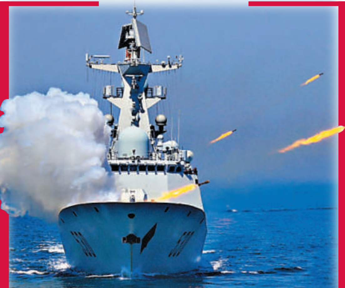
▲中國海軍「徐州」艦在南海軍演