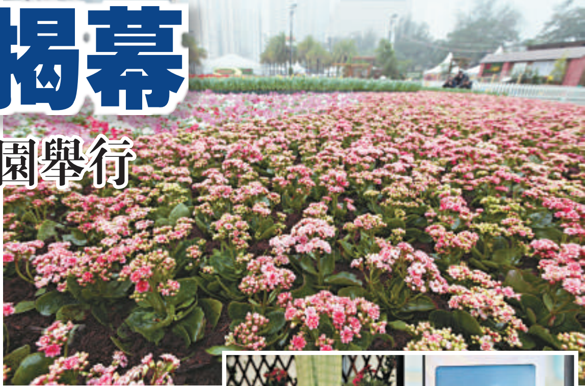
▲花卉展覽展出超過三十五萬株花卉

►會場四萬株家樂花演變為各種動物及海洋生物，包括鱷魚仔、八爪魚、龍蝦及海星等