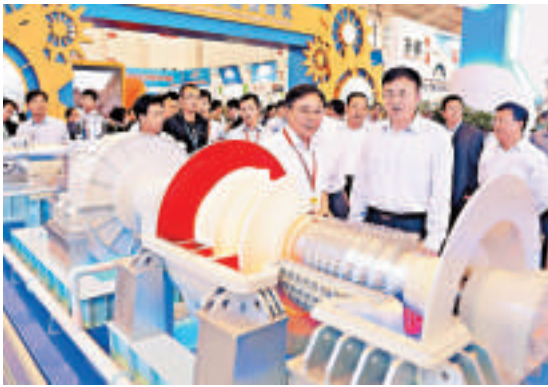
▲瀋鼓「十萬空分裝置mac180軸流一離心機組」，於去年瀋陽舉行的「第十二屆中國國際裝備製造業博覽會」上展出