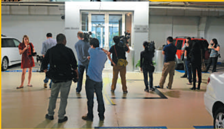
▲中本聰6日接受專訪時，大批記者聚集在美聯社加州總部車庫等候