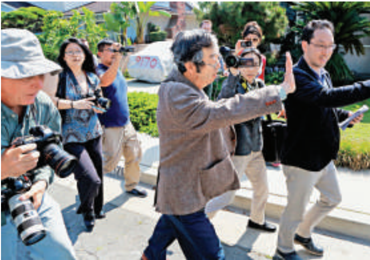
▲中本聰（中）與美聯社記者（右）一起離開

【大公報訊】綜合路透社、美國《華爾街日報》7日消息：《新聞周刊》踢爆坐擁4億美元（約31億身家）比特幣的比特幣創始人「中本聰」真實身份之後，數十名記者蜂擁到文中提及的洛杉磯附近的住所，鄰居也聚集在門外看熱鬧，記者找郵差搭話還一再按門鈴，卻徒勞無功。警車好幾度經過但沒有停下來。