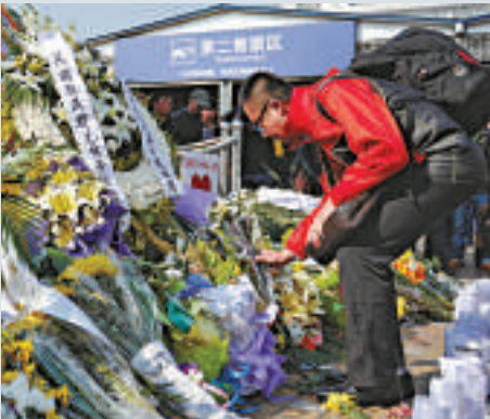
▲美國駐成都領事館亦送來了花圈