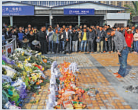
▲民眾自發來到昆明火車站，深切哀悼遇難者

【大公報訊】據新華社北京七日消息：東盟、歐盟輪值主席國希臘等組織和國家近日繼續對3月1日發生在雲南昆明火車站的嚴重暴力恐怖事件予以強烈譴責。