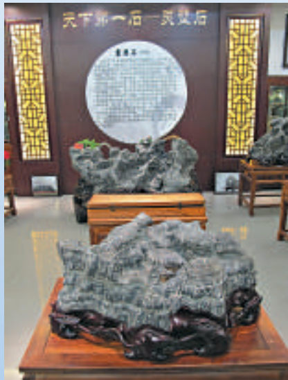
▲東方磊石天津館一角

自然，人類之師；石頭，自然之本，凝日月之精華，吸大地之靈氣，鬼斧神工，奇異多姿。交之為友，敬之為師；藏之健身，貴之善性，供之呈祥，拜之遂願。東方磊