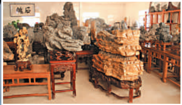
▲東方磊石企業裡形態各異的靈璧石