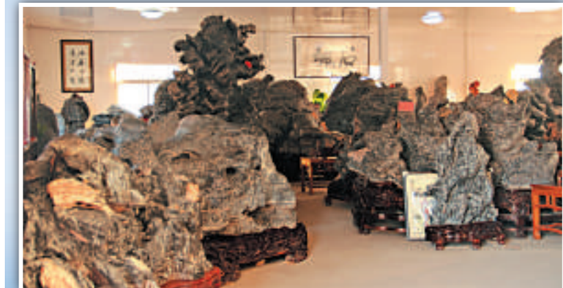
▲東方磊石企業裡形態各異的靈璧石