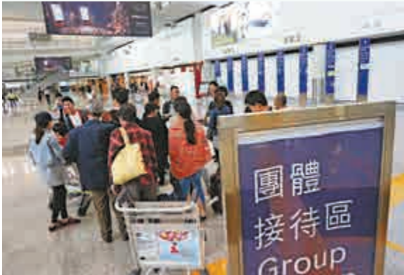
▲粵旅遊質量監督管理所春節期間接到不少港澳遊投訴