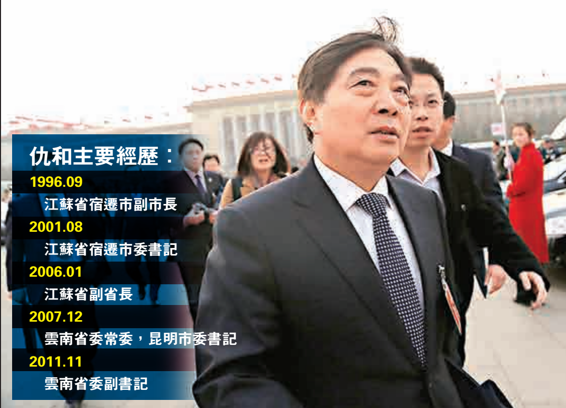
▲14日，仇和參加十二屆全國人大三次會議的雲南代表團舉行全體會議