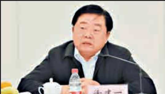
▲中國第一汽車集團公司董事長、黨委書記徐建一目前正接受組織調查 資料圖片

徐建一則成為繼中石油蔣潔敏、王永春及華潤宋林、中銘孫兆學、港中旅王帥廷等之後，又一位被查處的央企老總。去年中央第十三巡視組對一汽進行了巡視發現：頂風違紀問題時有發生，汽車銷售、資源配置領域腐敗問題多發。今次徐建一落馬，巡視組再立新功。而今年中央巡視組首輪26個巡視對象全部為央企，央企已成反腐主戰場。