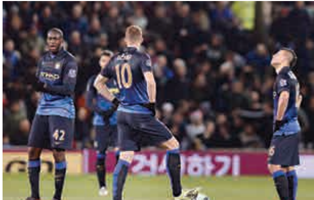
▲曼城差不多提早與英超錦標說再見

今戰唯一入球出現於61分鐘，般尼鋒將佐治保迪在禁區邊第一時間撞射破網。表現又一次在水準以下的曼城，有大衛施華和阿古路先後浪費黃金機會，補時薩巴利達連在禁區內遭主隊守將實美錫跌又未獲利12碼，結果幾可提早宣布英超衛冕失敗。 今仗是曼城超過1年來，首次在英超作客未能取得入球，對上一次已是去年2月他們作客打和諧域治0：0。柏歷堅尼坦言球隊是有點不妥，他說：「我們未能如慣常般取得勝利，我們未能取得入球，比賽中已隊有3至4次破門機會，對手只有1次但就射入一記漂亮入球。」