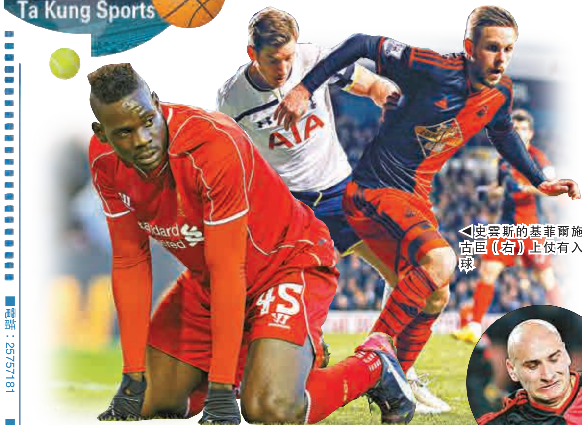
▲巴洛迪利在本季相當失敗