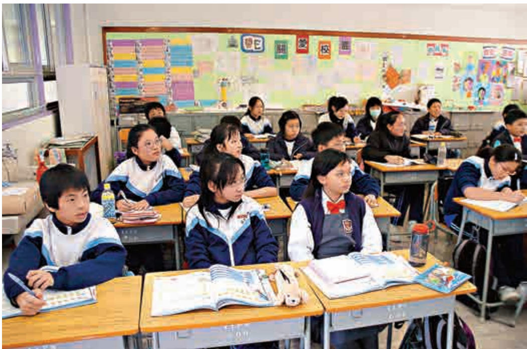
◀寫字像穿衣，影響別人對我們的印象

香港的教育目標：「讓每個人在德、智、體、群、美各方面都有全面而具個性的發展，能夠一生不斷自學、思考、探索、創新和應變，有充分的自信，合群的精神，願意為社會的繁榮、進步、自由