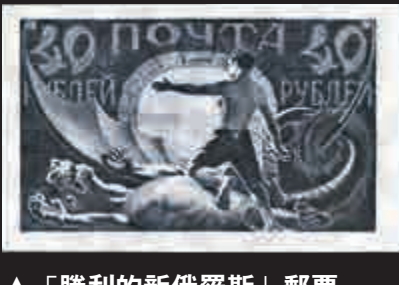
▲「勝利的新俄羅斯」郵票