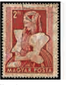
▲「各地區婦女民族服裝」郵票