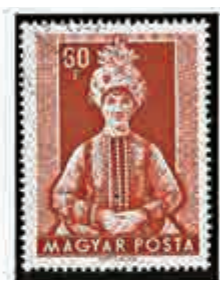
▲「各地區婦女民族服裝」郵票

夏衍，原名沈乃熙，中國著名文學、電影、戲劇作家，文藝評論家，翻譯家，社會活動家。建國後歷任上海市委常委、宣傳部長、文化部副部長、中國文聯副主席、中日友協會長、中顧委委員等，他還是中國第一代集郵家，在集郵界享有盛譽。今次的展品均為夏衍和他的家人多次捐贈給上海博物館。牽出一段「個人雅好」皈依「國家情懷」的佳話。