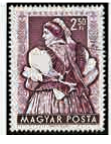
▲「各地區婦女民族服裝」郵票