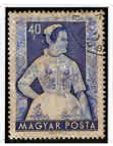
▲「各地區婦女民族服裝」郵票