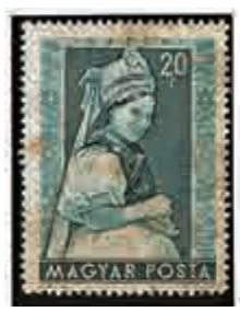
▲「各地區婦女民族服裝」郵票