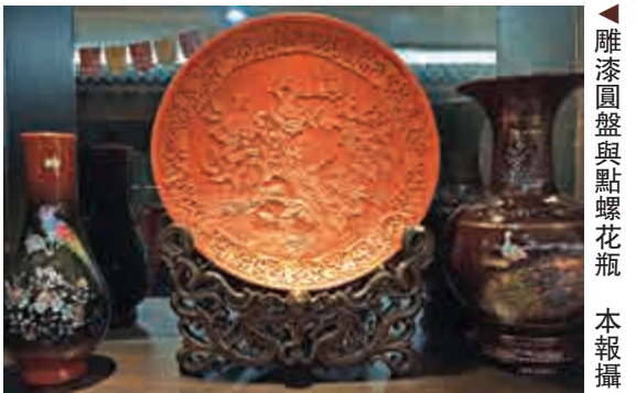
▲雕漆圓盤與點螺花瓶