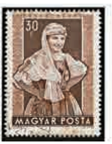
▲「各地區婦女民族服裝」郵票