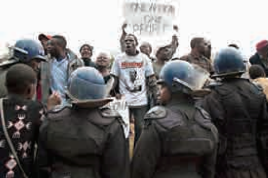
▲津巴布華民眾17日在南非駐哈拉雷使館外抗議南非排外

中國駐南非使領館已多次提醒旅南中國公民注意 safety，正密切跟蹤事態發展，敦促當地警方加強中國僑胞聚集地區的警力，全力保護中國僑胞的生命和財產安全。同時，使領館還提醒廣大中國僑胞，近日須主動跟蹤當地安全形勢，根據自身情況做好財產保護工作，必要時騷亂區及鄰近地區務必關閉商店，以保證自身的人身安全不受到傷害。