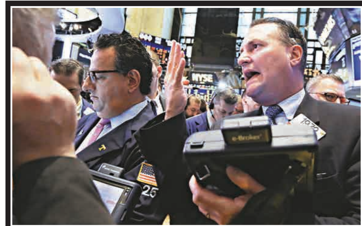
▲彭博終端機17日死機，全球交易員受影響