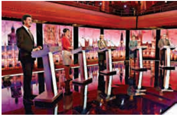
▲英國五大在野黨黨魁16日舉行新一輪辯論

根據民調機構survation在辯論後調查結果顯示，工黨成了當晚最大贏家，文立彬支持率躍升至45%，領先了卡梅倫5個百分點。不過，因為主要對手卡梅倫缺席辯論，這個調查結果恐怕很難算數，但最重要的是製造出領先的聲勢，分分鐘能吸引到一大批跟風的選民。