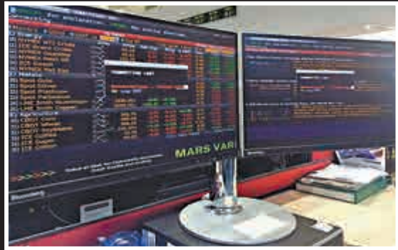
▲有交易員在推特發圖抱怨彭博終端機死機