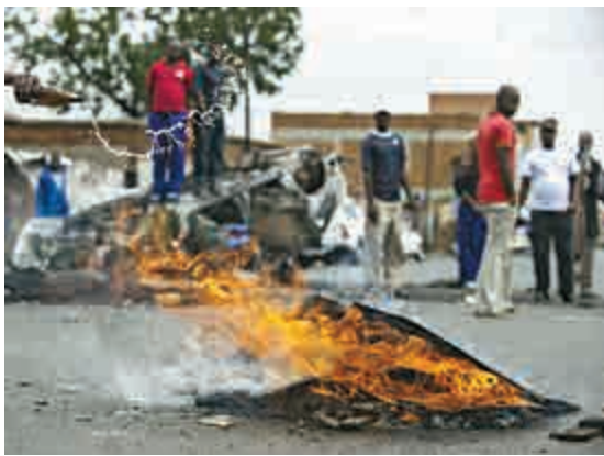
▲南非約翰內斯堡發生排外示威，多人被捕