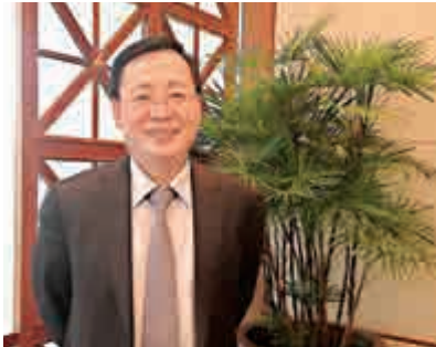
◀林中表示，公司未來三、五年的增長仍會維持過去幾年的高水平

放鬆，效果需時彰顯，故預料5至6月的市場反應較為明顯。公司今年推13個新盤，當中9個為下半年推出。他又預料，內房企今年不會減價促銷，其中一線城市樓價更會上升，二、三線城市則較平穩，公司今年將主要在一線城市補充土地。