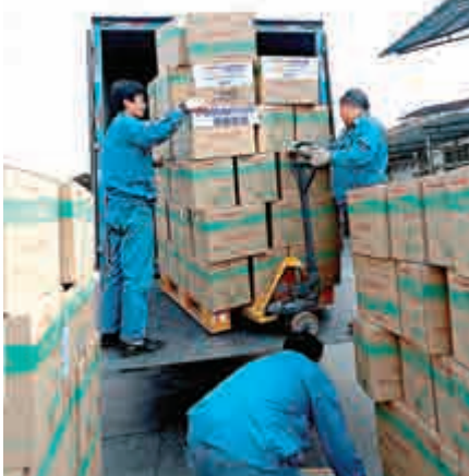
◀復星醫藥配售新股，集資58億

到5000張，以此計算，即床位數目將大增80%。同時，去年集團每張床的平均收入約40萬元，按此推算，若床位增到5000張，一年平均收入便可達20億元。他又透露，有意併購四川的醫院，因四川為西南部地區經濟中心，本身亦有好的醫院，但最終也要視乎實況而定。