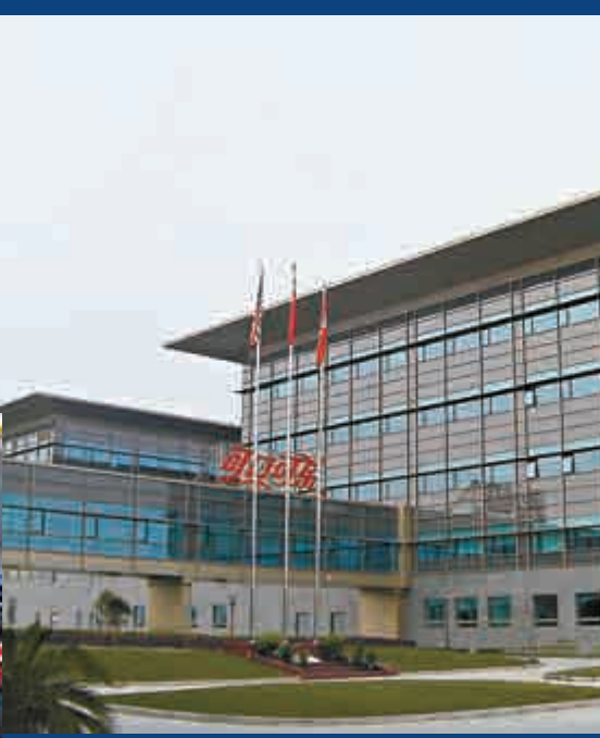
◀中國粗糧王飲品訂立股權轉讓協議，向可口可樂中國出售廈門粗糧王之全部股權