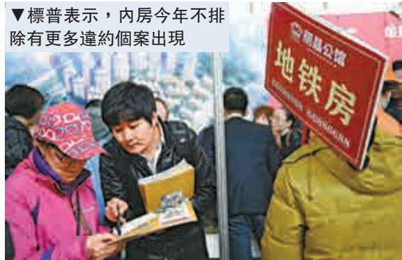
▼標普表示，內房今年不排除有更多違約個案出現

標普指出，中央及人民銀行最近出台的提振樓市氣氛措施，有助釋放市場需求，但相信對樓市的正面效果，要到下半年才能反映，信貸環境仍然偏緊，加上現時貸款方對內房的信心受到一定影響，相信未來12個月信貸情況改善空間有限。