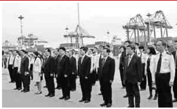
▲廈門市領導班子在象嶼碼頭參加福建自貿試驗區廈門片區揭牌儀式