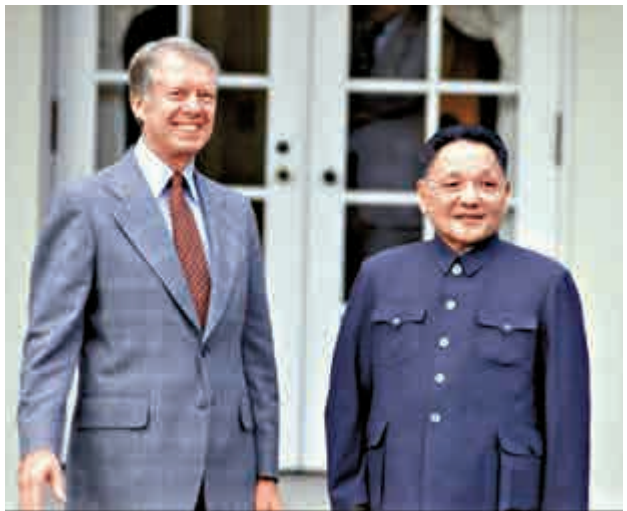
鄧小平訪美期間與卡特合影

《旋風九日》90%的影像資料是從美國買來的，90%以上的現場採訪是攝製組在美國沿着小平當年的訪問路線實地拍攝的。製片人呂木子透露，《旋風九日》中的資料是從美國的檔案館、卡特中心以及美國三大電視網的影像資料庫中找到並最終購得的。價格很高，每秒鐘影像高達250美元。呂木子透露，這還是有鄧小平幼女鄧榕幫忙才拿到的「優惠價」。鄧榕得知要拍這部片子，專門致信美國美中關係委員會有關人員，請幫忙協調攝製組在美國的有關事宜。