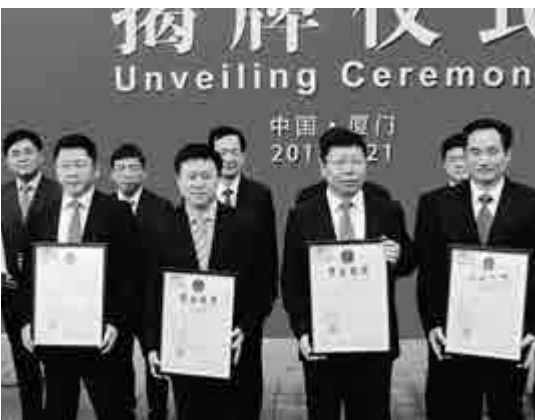
▲廈門片區掛牌後首批入區企業獲得營業執照

東南航運中心海滄港區重點發展航運物流、口岸進出口、保稅物流、加工增值、服務外包、大宗商品交易等現代臨港產業，構建高效便捷、綠色低碳的物流網絡和服務優質、功能完備的現代航運服務體系，成為立足海西、服務兩岸、面向國際，具有全球航運資源配置能力的亞太地區重要的集裝箱樞紐港。