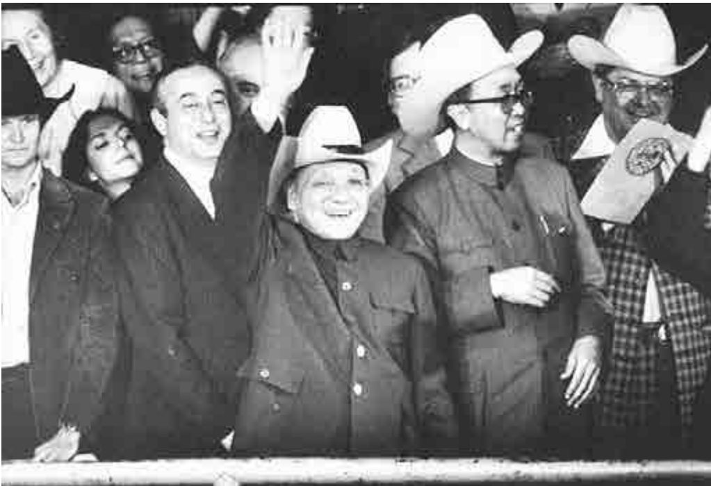
鄧小平在休斯敦西蒙頓小鎮競技場戴上牛仔帽。當日訪問之前，他曾遭遇3K黨策劃的刺殺事件。資料圖片

當鄧小平準備出門乘車時趕往西蒙頓競技場之前，突然又一個人直衝過來，並且把手伸向上衣裡。保羅·凱利疾步搶上前，一拳將對方擊倒，張寶忠保護鄧小平迅速上車。經審訊，這是3K黨策劃的刺殺事件。