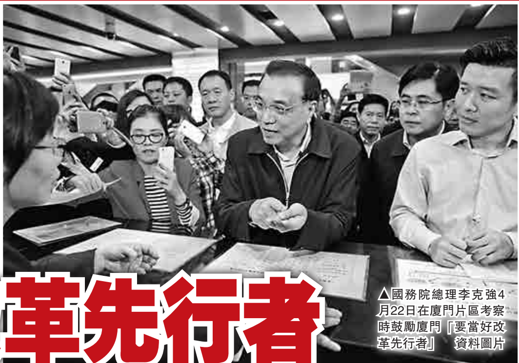
▲國務院總理李克強4月22日在廈門片區考察時鼓勵廈門「要當好改革先行者」