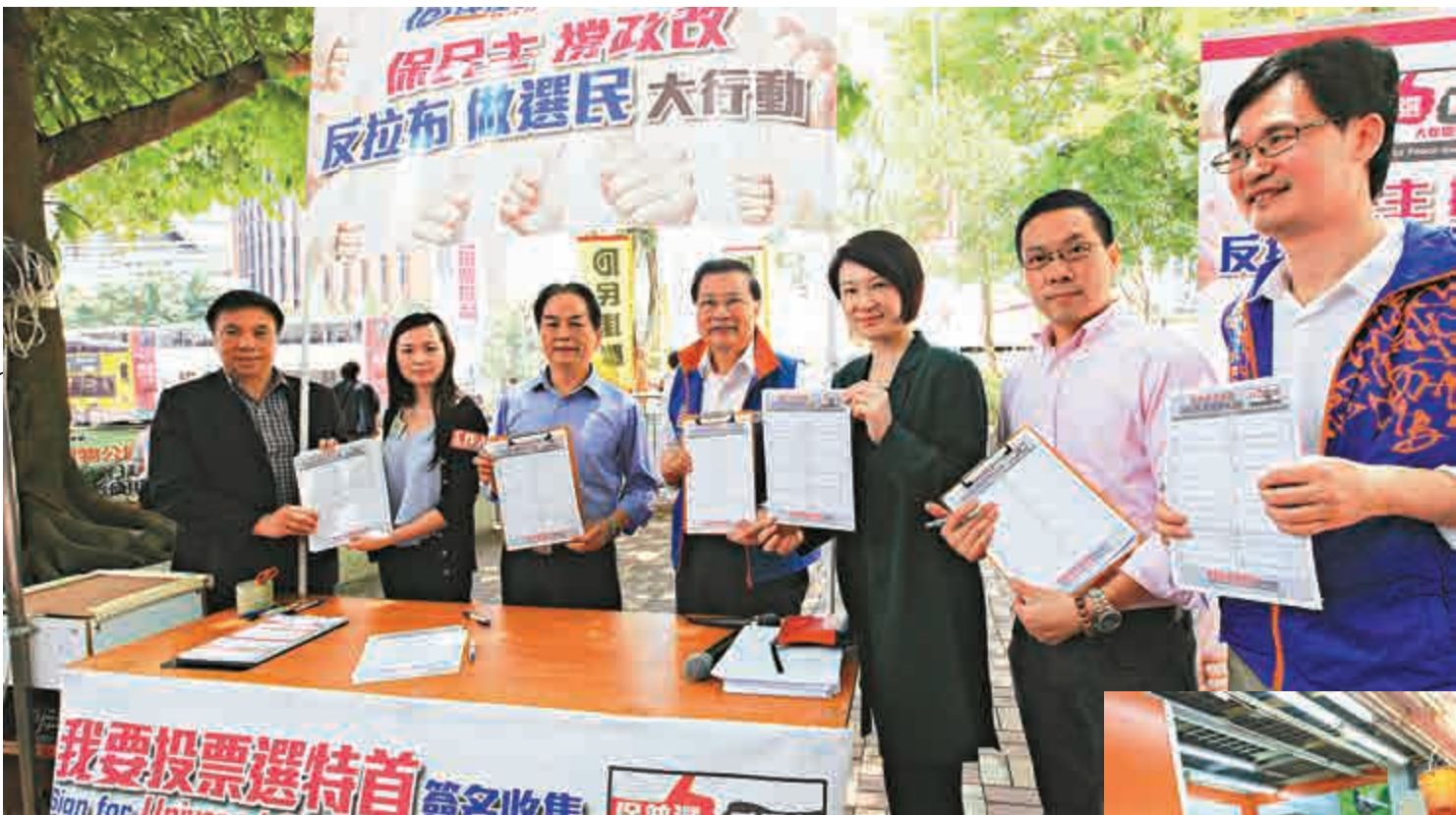
▲李慧琼（右三）、譚耀宗（左四）和鍾樹根（左一）昨聯同數名東區區議員到小西灣呼籲市民撐政改