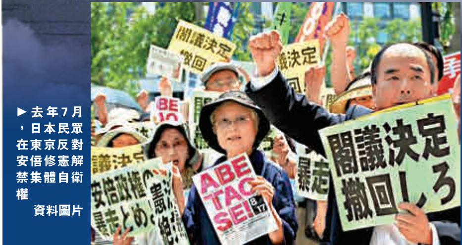
▶ 去年7月，日本民眾在東京反對安倍修憲解禁集體自衛權 資料圖片

在北京，外交部發言人華春瑩周二指出，中方注意到有關日菲軍演的報道並將予以密切關注。華春瑩表示，當前，南海局勢總體穩定，希望有關國家尊重地區國家自行維護南海和平穩定的努力，不要到處渲染緊張，不要做損害地區國家安全互信、影響本地區和平穩定的事。