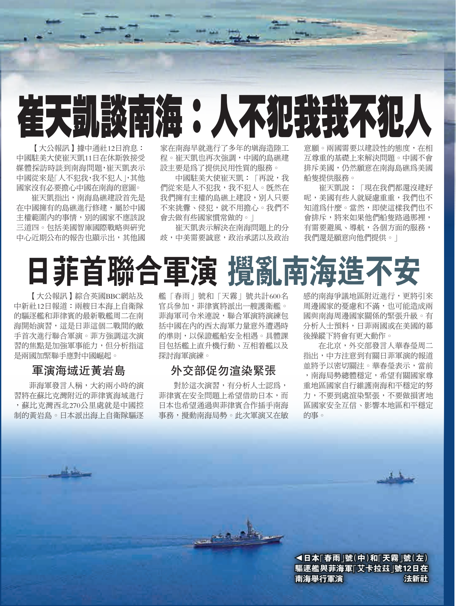
◀日本「春雨」號(中)和「天霧」號(左)驅逐艦與菲海軍「艾卡拉茲」號12日在南海舉行軍演

另外，黃大慧稱：重點就是安倍打「中國牌」，強調中國崛起的威脅，「中國要通過實力改變地區現狀」。這是在營造「中國威脅論」，在日本國內製造一種緊張的氣氛，來尋求獲得日本國內各方面的支持。應對中國崛起這一事實，日美是「相互借重」的，他們的目標是一致的。日美同盟很明顯主要是針對中國的，會引起中方的高度關注。日本已經把中國看做一個假想敵，並且對朝鮮半島也會造成一定的負面影響。