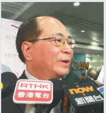
▲吳克儉：鼓勵教育界人士支持政改