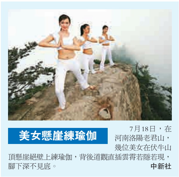
美女懸崖練瑜伽 7月18日，在河南洛陽老君山，幾位美女在伏牛山頂懸崖絕壁上練瑜伽，背後道觀直插雲霄若隱若現，腳下深不見底。

在偷渡至馬來西亞後，由於沒有任何身份證明，偷渡者寸步難行。團夥頭目帶他們去土耳其駐馬來西亞使館，騙取土耳其使館提供的身份證明。為了便於購買機票，他們還製造、變造了做工粗劣的假土耳其護照，買買提艾力就是當時做假護照的成員之一。 在境外的日子，買買提艾力發現，幾個不同的境外組織都試圖操控偷渡者，其中有「世維會」副主席塞依提·吐木吐魯克。遠在土耳其，一個