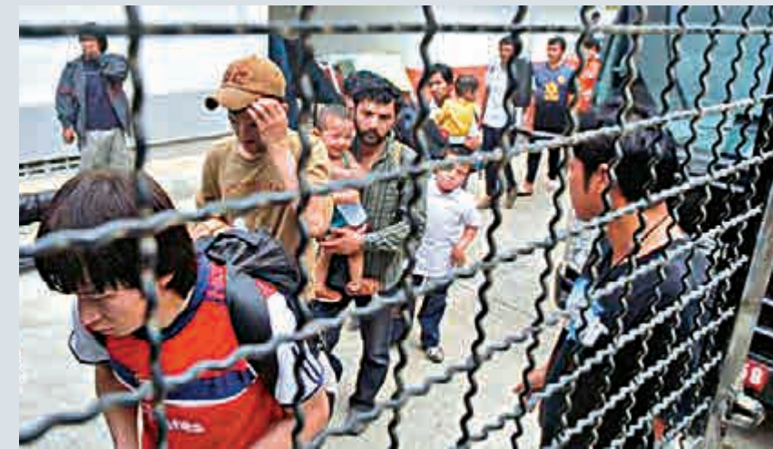
▲日前，警方從泰國遣返回國100餘名非法偷渡人員