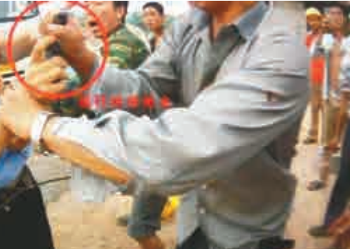
◀警方提供的視頻截圖指民工襲警搶槍 網絡圖片

據洛陽市公安局通報，經初步調查，7月18日17時40分許，該局110指揮中心接群眾報警稱，在310國道與小浪底專用線交叉口一建築工地門口，有人攔截施工車